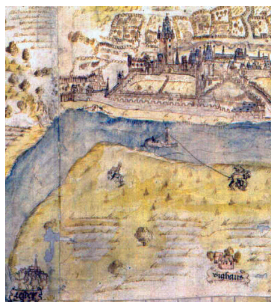
Das Leiderer „Sondersiechenhaus“ erscheint erstmalig in den Urkunden im Jahr 1471, als sieben Insassen, nachdem sie „fleißig gebadet“ hatten, nach Mainz zur ärztlichen Kontrolle geschickt wurden.