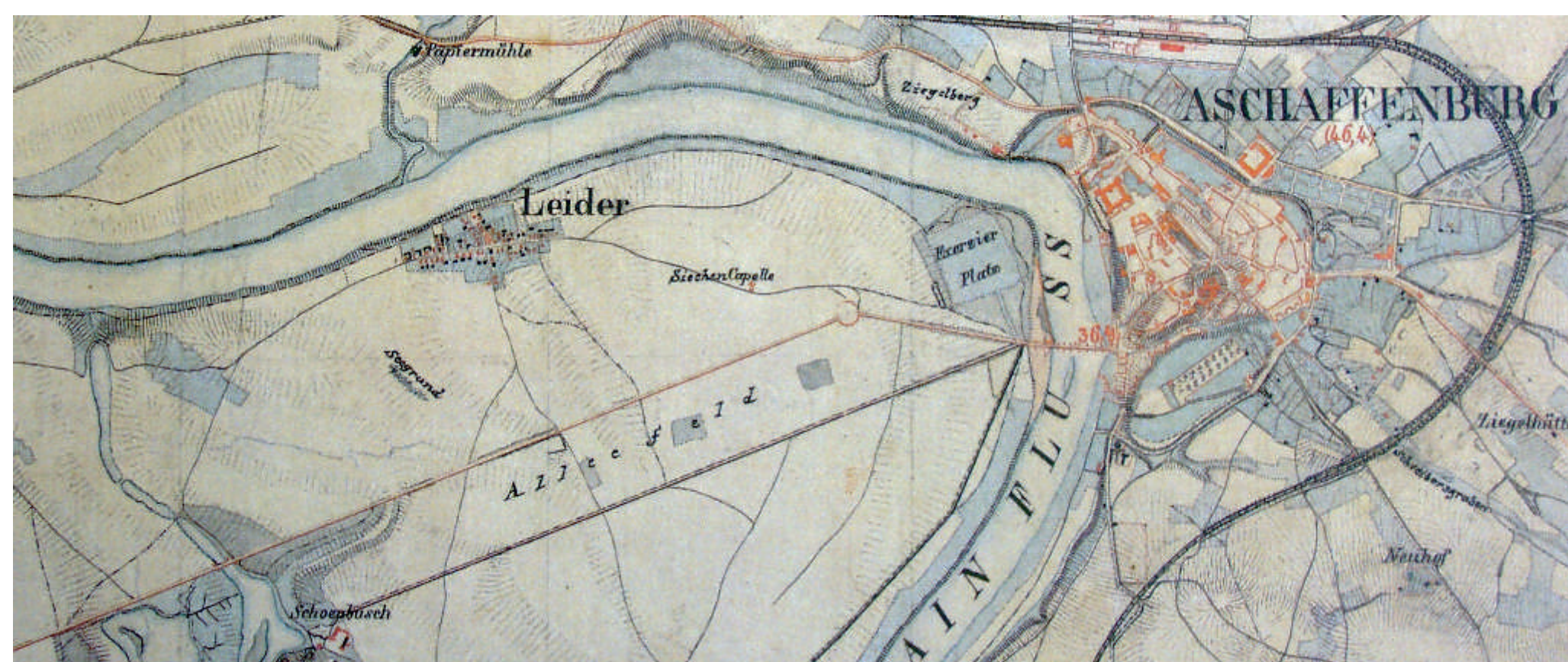
Auf dem Urkataster von 1850 liegen Leider und das Siechenhaus abseits der Ende des 18. Jahrhunderts erbauten Chaussee (heute Darmstädter Straße).