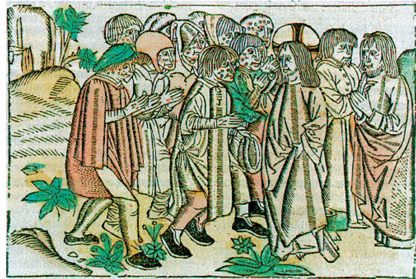
Auf dem Holzschnitt von 1499 zeigen sich die Leprakranken „gut betucht“. Auch wohlhabende Erkrankte wurden in Spitälern aufgenommen. Die überall etablierten Stiftungen konnten ihre Schützlinge gut ausstatten. Die entzündlichen Hautveränderungen sind als rote Flecken dargestellt. Besonders das Schuhwerk fällt auf. Offenbar war bekannt, dass die Füße von Leprakranken in besonderem Maße gefährdet sind.

Das Leiderer „Sondersiechenhaus“ war eine Außenstelle des Aschaffener Elisabethenspitals im Löhergraben an der Mainbrücke. Da die Ansteckungsgefahr von Lepra bekannt war, wurden die Aussätzigen in dem separaten Gebäude auf dem Leiderer Feld isoliert. Hier erhielten sie Nahrung, aber auch geistliche Betreuung. Aschaffener Bürger sorgten durch Almosen, Legate und Stiftungen für einen Teil des Unterhaltes der Heiminsassen. Den größten Teil der Kosten übernahm der Sondersiechenhausfond.