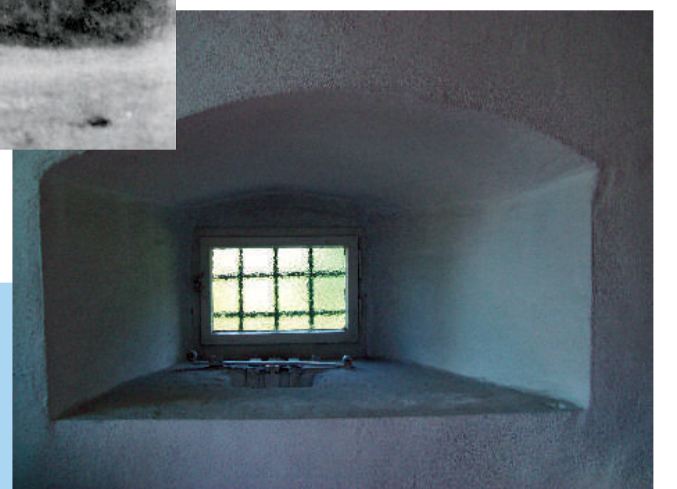
In der Kapelle befindet sich ein Opferstock für Geldspenden, die von außen - ohne in Kontakt mit den Kranken zu kommen - eingeworfen werden konnten.

Life in the Middle Ages and even the early modern times was much under the threat of contagious and lethal diseases, leprosy being one of the major scourges. Therefore in nearly all towns of central Europe leper hospitals were set up, not only for taking care of the lepers, but also for isolating them from the public. A document from the year 1471 is the earliest evidence that such a hospital stood on a field outside Leider, belonging to St. Elisabeth's Hospital of Aschaffenburg. No trace has been left of it, but the chapel that once belonged to it has survived.