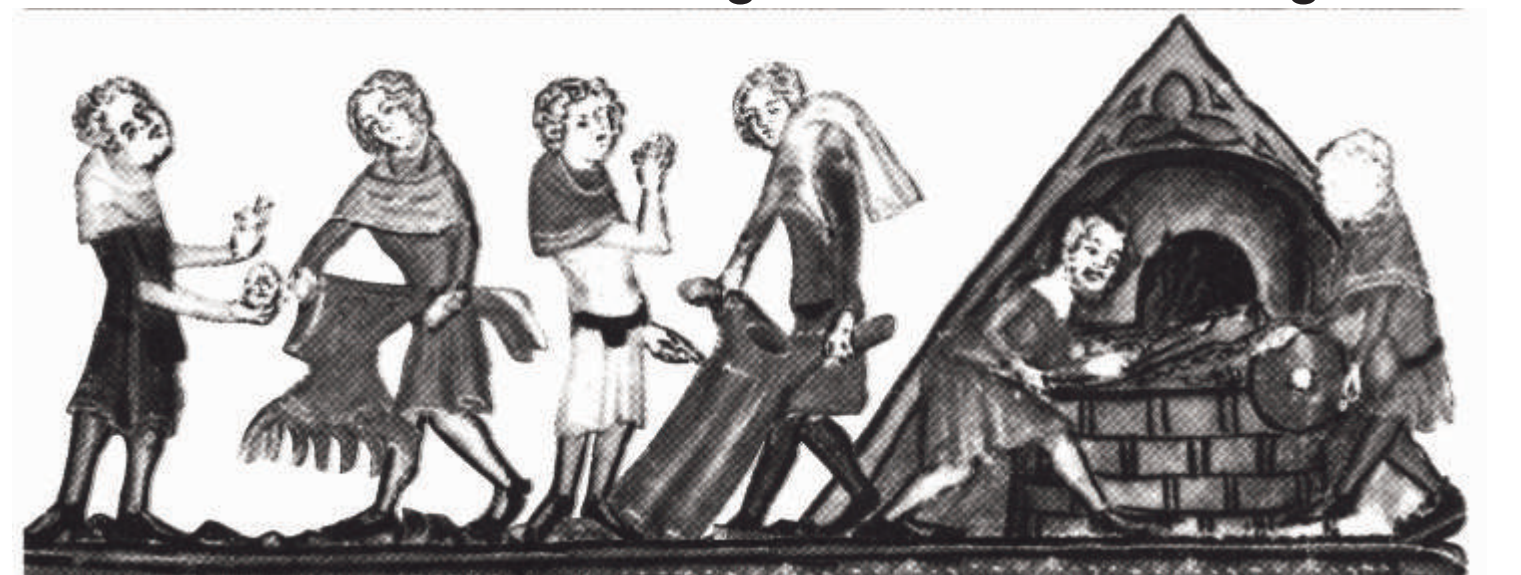
Auch im Mittelalter war bekannt, dass die Kleidung Aussätziger nicht weiter verwendet werden konnte und verbrannt werden musste.

Während von dem Siechenhaus selbst nichts mehr vorhanden ist, steht die dazu gehörige Kapelle heute noch in der Kapellenstraße. Sie erscheint zuerst im Jahr 1574 bezeichnenderweise in Zusammenhang mit der Anordnung ihres Abrisses. Mit den Holzteilen, Steinen und Ziegeln sollte die Leiderer Laurentiuskirche (die heutige Lukaskirche) instandgesetzt werden. Doch konnte dieses Vorhaben vereitelt werden, so dass sich die aktuelle Siechenhauskapelle als Teil eines einst größeren Kirchenbaues darstellt.