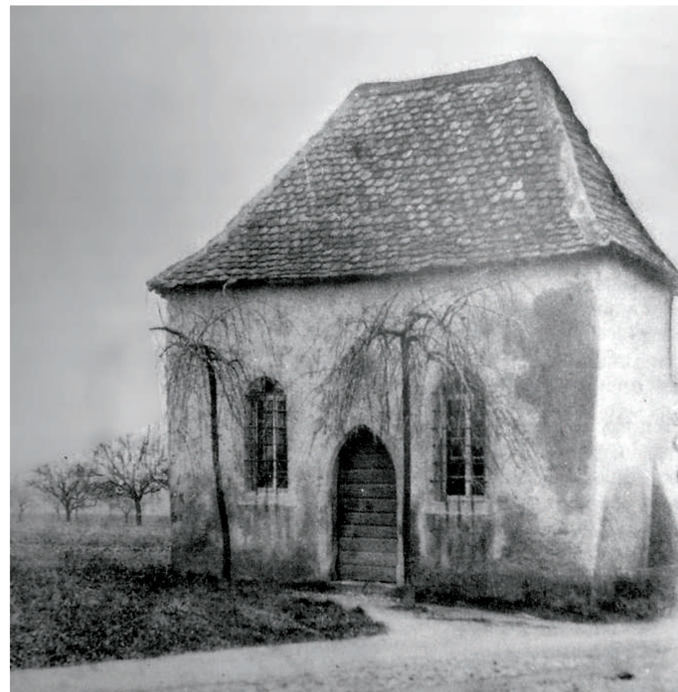
Die Siechenhauskapelle, in Leider „Kapellchen“ genannt, auf einer Fotografie um 1900 noch auf freiem Feld.

Kapelle heute noch in der Kapellenstraße. Sie erscheint zuerst im Jahr 1574 bezeichnenderweise in Zusammenhang mit der Anordnung ihres Abrisses. Mit den Holzteilen, Steinen und Ziegeln sollte die Leiderer Laurentiuskirche (die heutige Lukaskirche) instandgesetzt werden. Doch konnte dieses Vorhaben vereitelt werden, so dass sich die aktuelle Siechenhauskapelle als Teil eines einst größeren Kirchenbaues darstellt.