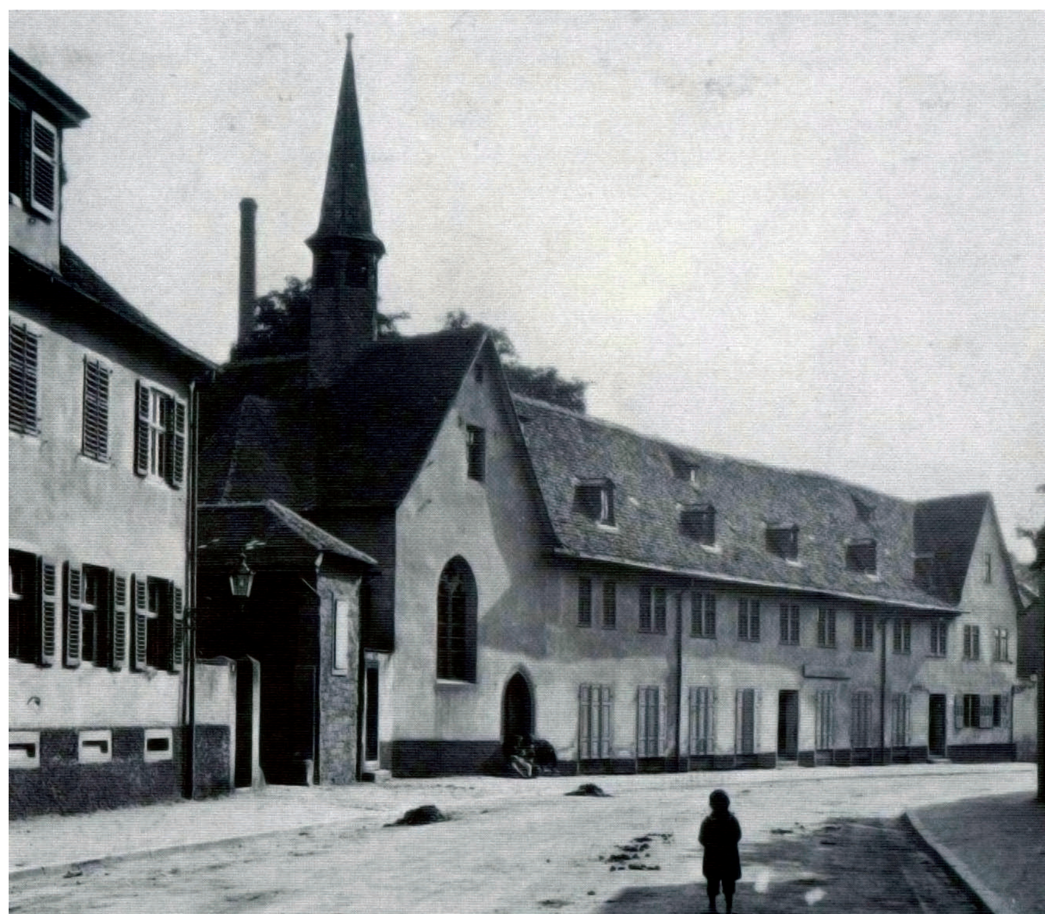
Das Foto vor 1945 zeigt das „neue Spital“ (Katharinenspital), das 1604-1610 an der Stelle des „alten Spitals“ (Elisabethenspital) in Aschaffenburg, das Mutterhaus des Leiderer Siechenhauses, erbaut wurde.

Das Leiderer „Sondersiechenhaus“ war eine Außenstelle des Aschaffener Elisabethenspitals im Löhergraben an der Mainbrücke. Da die Ansteckungsgefahr von Lepra bekannt war, wurden die Aussätzigen in dem separaten Gebäude auf dem Leiderer Feld isoliert. Hier erhielten sie Nahrung, aber auch geistliche Betreuung. Aschaffener Bürger sorgten durch Almosen, Legate und Stiftungen für einen Teil des Unterhaltes der Heiminsassen. Den größten Teil der Kosten übernahm der Sondersiechenhausfond.