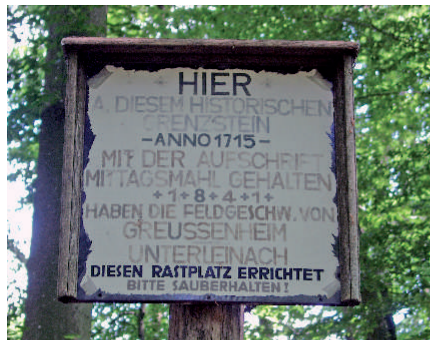
1975 wurde diese Tafel errichtet, als sich die Feldgeschworenen von Unterleinach und Greußenheim zum „Mittagstisch“ trafen.