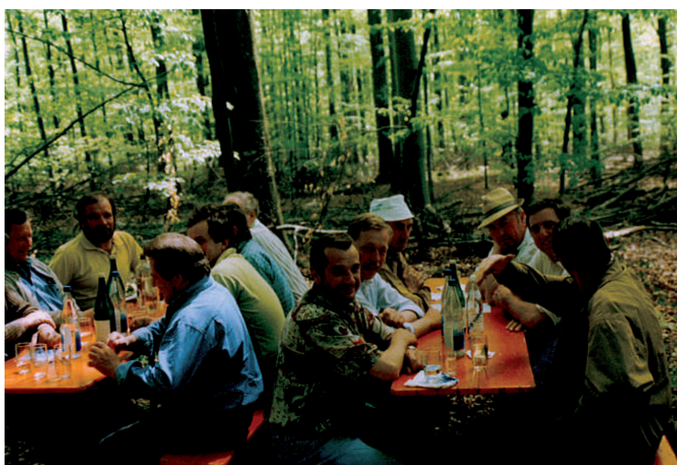
Die alljährliche Feier der Feldgeschworenen am Mittagstisch

„Fürchte Gott, tue Recht und scheue niemanden“, ist seit 1715 gültiges Motto der Feldgeschworenen, der „Siebener“. Ältestes, noch erhaltenes Ehrenamt der kommunalen Selbstverwaltung. Das Ehrenamt ist im 13. Jahrhundert in Franken entstanden. Dort erkannten die fränkischen Gerichte, dass vor Ort Ansprechpartner in den einzelnen Dörfern nötig waren, die sich mit den lokalen Gegebenheiten auskannten und die Grenzbeaufsichtigung gewährleisteten. Aufgabe der Feldgerichte war es, in Grenzangelegenheiten Schiedssprüche zu fällen. So wurden die Feldgeschworenen zu Hütern der Grenzen und Abmarkungen. Die Feldgeschworenen haben je nach Region verschiedene Bezeichnungen: Siebener, Vierer, Dreier, Untergänger, Märker, Feldscheider usw. Die Verpflichtung der Untergänger war stets mit einem Eid verbunden. Die Eidesformel der fränkischen Siebener lautet: Ich schwöre, den durch das Abmarkungsgesetz und die hierzu erlassenen Dienstanweisungen mir zugewiesene Obliegenheiten stets genau und gewissenhaft nachzukommen, meines Amtes unparteiisch, nach bestem Wissen und Gewissen zu walten und das mir anvertraute Siebenergeheimnis zeitlebens treu zu bewahren.