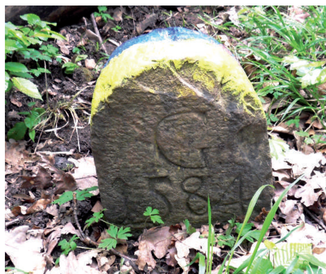
Der älteste Grenzstein der Greußenheimer Gemarkung stammt aus dem Jahr 1584.

Siebenergeheimnis Die Feldgeschworenen schützen die Grenzzeichen durch Unterlegen geheimer Zeichen gegen willkürliche Versetzung. Diese „Siebenerzeichen“ sind meist besonders geformte und vielfach auch beschriftete Zeichen aus Ton, Glas, Porzellan oder Metall. Die Art des Unterlegens war Bestandteil des Siebenergeheimnisses und wurde von Gemeinde zu Gemeinde unterschiedlich gehandhabt.