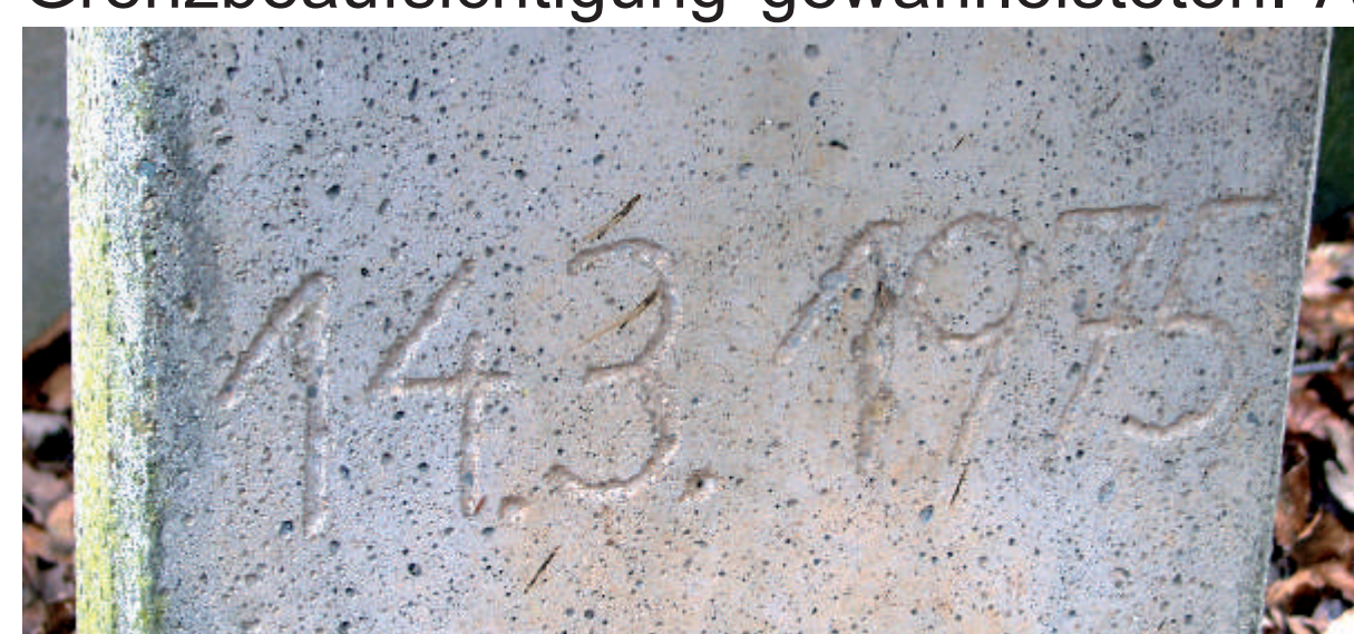
Die jüngste Jahreszahl 1975 markiert den Tisch aus Beton.

Märker, Feldscheider usw. Die Verpflichtung der Untergänger war stets mit einem Eid verbunden.