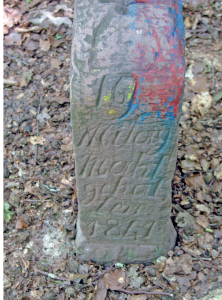
Im Jahr 1841 wurde „Mitag Mahl gehalten“.

Ich schwöre, den durch das Abmarkungsgesetz und die hierzu erlassenen Dienstanweisungen mir zugewiesene Obliegenheiten stets genau und gewissenhaft nachzukommen, meines Amtes unparteiisch, nach bestem Wissen und Gewissen zu walten und das mir anvertraute Siebenergeheimnis zeitlebens treu zu bewahren.