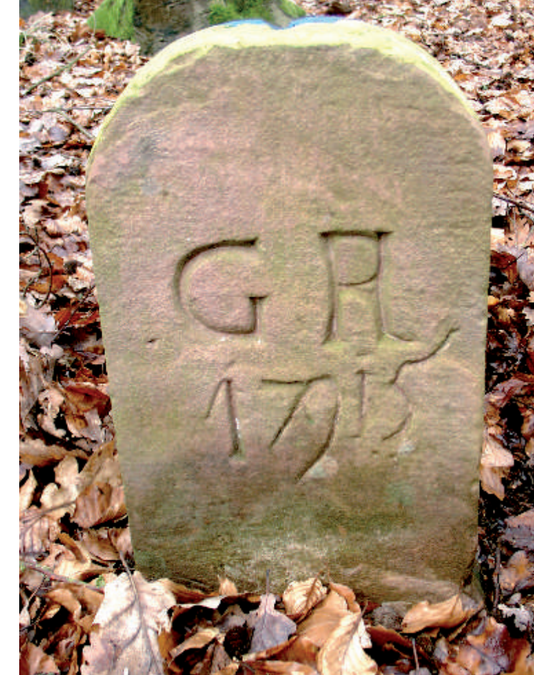
Der Grenzstein wurde offensichtlich zweimal behauen: 1715 mit GR und 1791 mit GH.

Erst aus Urkunden des 16. Jahrhunderts geht eindeutig hervor, dass Untergänger die Setzung der Marksteine überwachten. Beachtenswert sind die für die Untergänger geforderten Eigenschaften.