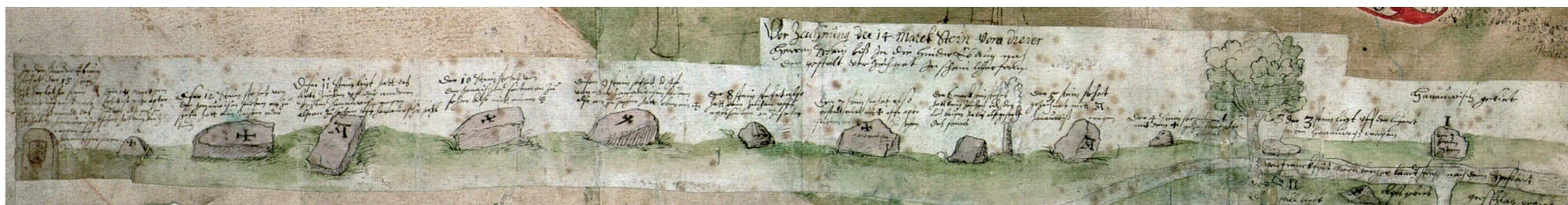
Auf einer Spessartkarte des Jahres 1584 sind die Grenzsteine entlang der Kurmainz-Hanauer Gemarkung gezeichnet und beschrieben. In Greußenheim hat sich ein Grenzstein aus dieser Epoche erhalten - ebenfalls mit der Jahreszahl 1584 (Zufall? Wir wissen es nicht.). In dieser Epoche, zur Zeit des Fürstbischofs Julius Echter, wurden die Territorien des Hochstifts Würzburg abgesteckt.

Alljährlich treffen sich die Feldgeschworenen von Unterleinach und Greußenheim zum Mahl am Mittagstisch an der Gemarkungsgrenze zwischen den beiden Gemeinden. In der frühen Neuzeit waren Grenzziehungen