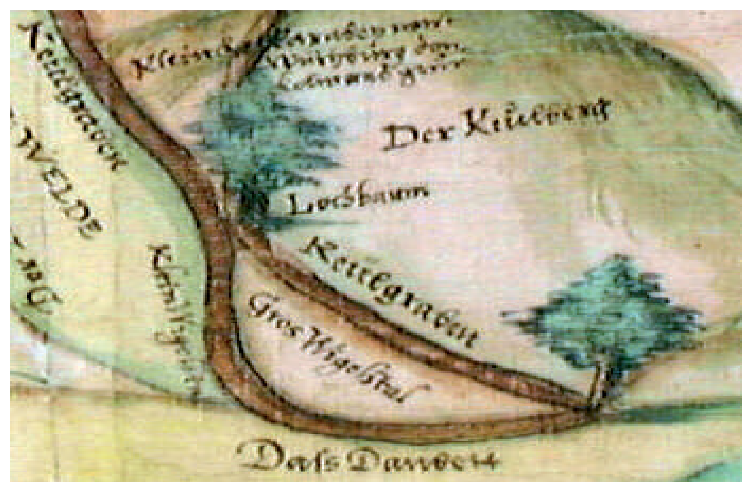
Auf der Hafenohtalkarte von ca. 1570 sind zwei „Lochbäume“ eingezeichnet. „Loch“ oder „Lach“ bedeutet „Grenze“, ein Wort, das aus dem Slawischen erst seit dem 16. Jahrhundert ins Deutsche einwanderte.

Daß hierzu feldverständige Leute erfordert werden: ist von selbst klar. Sie müssen aber neben deme alle diejenige Eigenschaften haben, welche wegen einem jeden Richter vorgeschrieben sind. Es sollen nemlich gottesfürchtig, verständige, eheliche, verschwiegene, unverläumdete und volljährige Leute