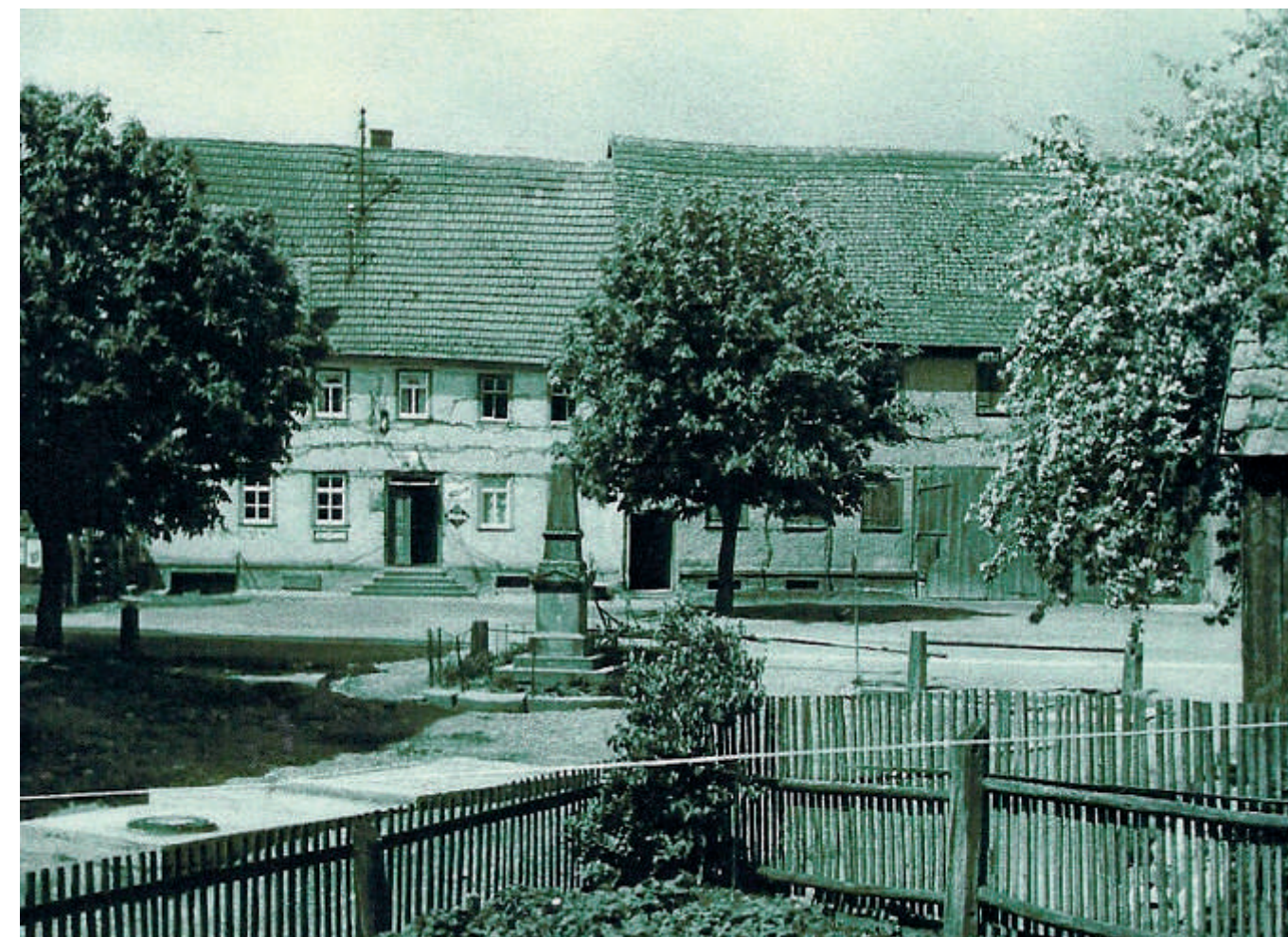
Blick auf die Straßenkreuzung mit dem Kriegerdenkmal in der Mitte und mit dem Gasthaus „Weißes Ross“ (1962)

Die Tatsache, dass sich an der Kreuzung ein altes Gasthaus befand und dass hier auch das Denkmal für die Kriegsteilnehmer von 1866 und 1870/71 aufgestellt wurde, macht jedenfalls deutlich, dass die Kreuzung einst größere Bedeutung hatte. Nicht zuletzt bestätigt auch die früher den Kindern erzählte Geschichte, der Storch bringe den Altfelder Nachwuchs aus dem Grabenbrunnen, den Ursprung im unteren Teil des Dorfes. Hier entspricht die Besiedlung auch der Form des fränkischen Haufendorfes.