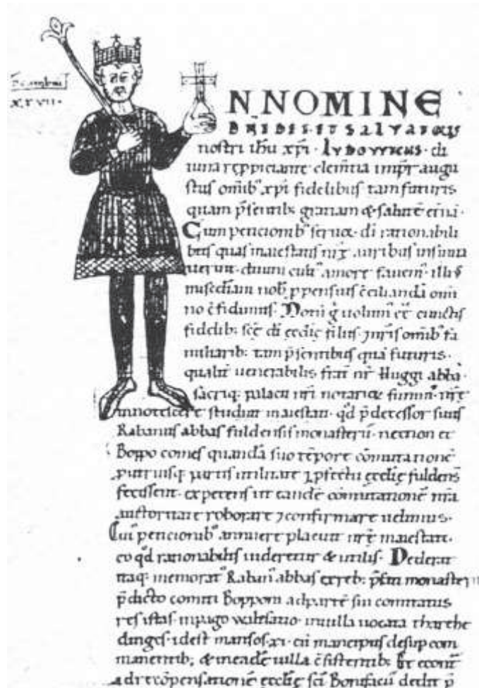
Die Urkunde von 839 in einer Kopie des Mönchs Eberhard aus dem 12. Jahrhundert.

Das älteste schriftliche Zeugnis für Altfeld liefert eine um 1150 gefälschte Schenkungsurkunde Karls des Großen von 794 für die Benediktinerabtei Neustadt am Main. Als glaubwürdigster Teil dieser Urkunde wird die Grenzbeschreibung des Neustädter Spessarts betrachtet, in der die Altfelder Höhe („supremum Altfilde“) als südlicher Grenzpunkt aufgeführt ist.