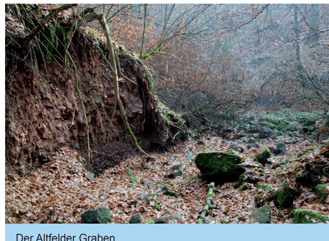
Der Altfelder Graben

Berührt wird Altfeld indirekt auch in einer Urkunde von Kaiser Ludwig dem Frommen von 839, in der ein Tausch zwischen der Abtei Fulda und dem Grafen Poppo festgehalten wird. Fulda erhält aus dem Grafengut Remlingen einen Teil des Spessartforstes. Die Reichsabtei Fulda, die 839 den südöstlichen Teil des Spessarts (in der Karte schraffiert)