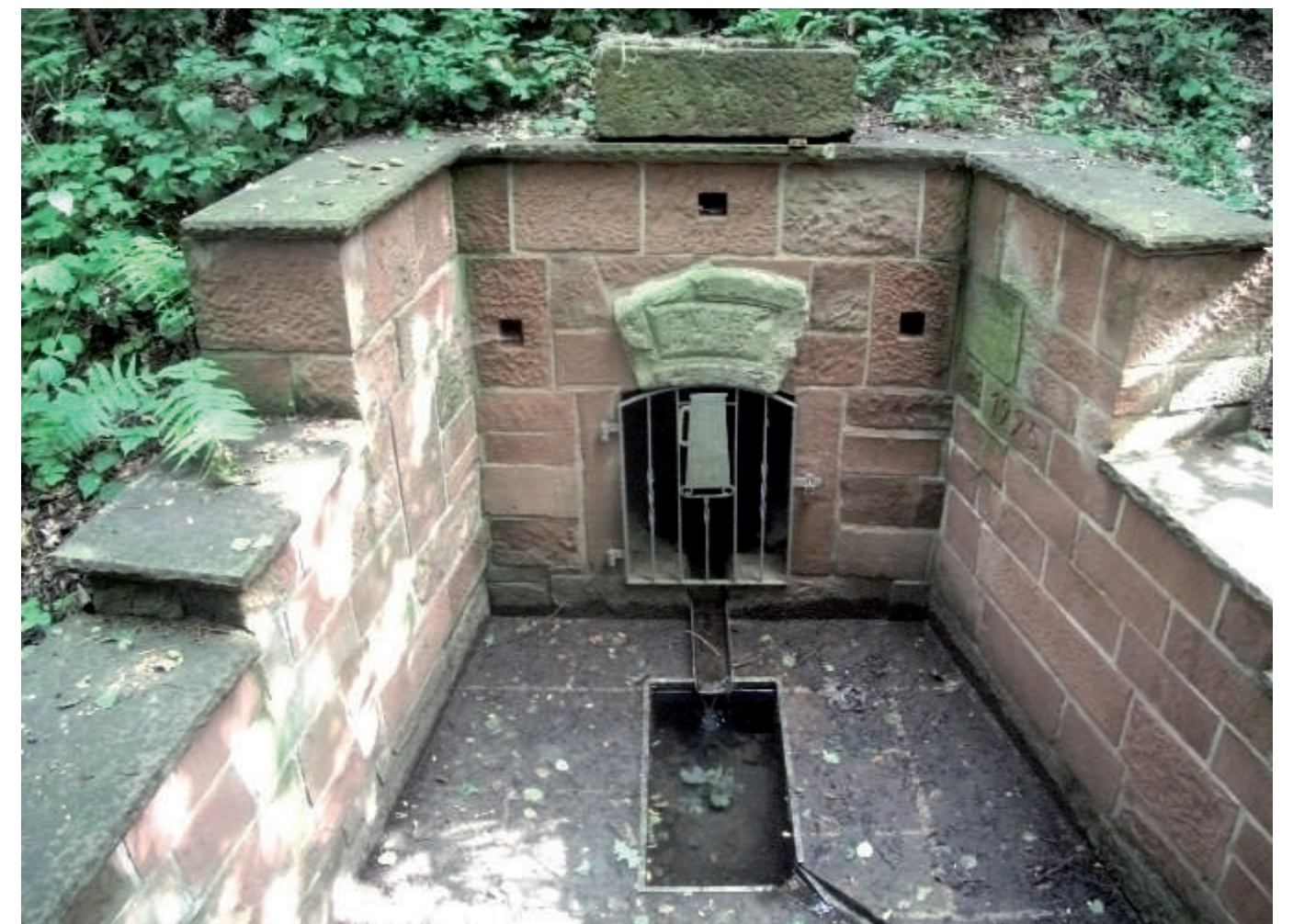
Das Grabenbrünnle erreicht nach wenigen Treppenstufen im Altfelder Graben.

Der Altfelder Graben hat auch eine Beziehung zum Flachs, der üblicherweise in einem Brechhaus in der Nähe eines Brunnens oder Bachlaufes bearbeitet wurde. Ein solches Brechhaus gab es auch in Altfeld am Graben, wo der Grabenbrunnen das benötigte Wasser lieferte. Ein zweites Brechhaus gab es im „Öwerdorf“, im oberen Teil des Dorfes, am Trieb.