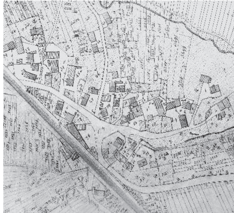
Die Uraufnahme von Altfeld von ca. 1840 zeigt rechts oben den Märzengraben, die von Norden heranziehende Rodgasse, in der Bildmitte rechts den Beginn des Altfelder Grabens mit Grabenbrunnen und Brechhaus und den kleinen dreieckigen Platz, an dem alle Straßen zusammenlaufen.

Nach der Brücke der Bundesstraße 8 folgt parallel der „Märzengraben“, einer sich immer tiefer eingrabenden mit Buschwerk bewachsenen Geländemulde, möglicherweise dem Rest eines „Dorfhags“, womit sich ländliche