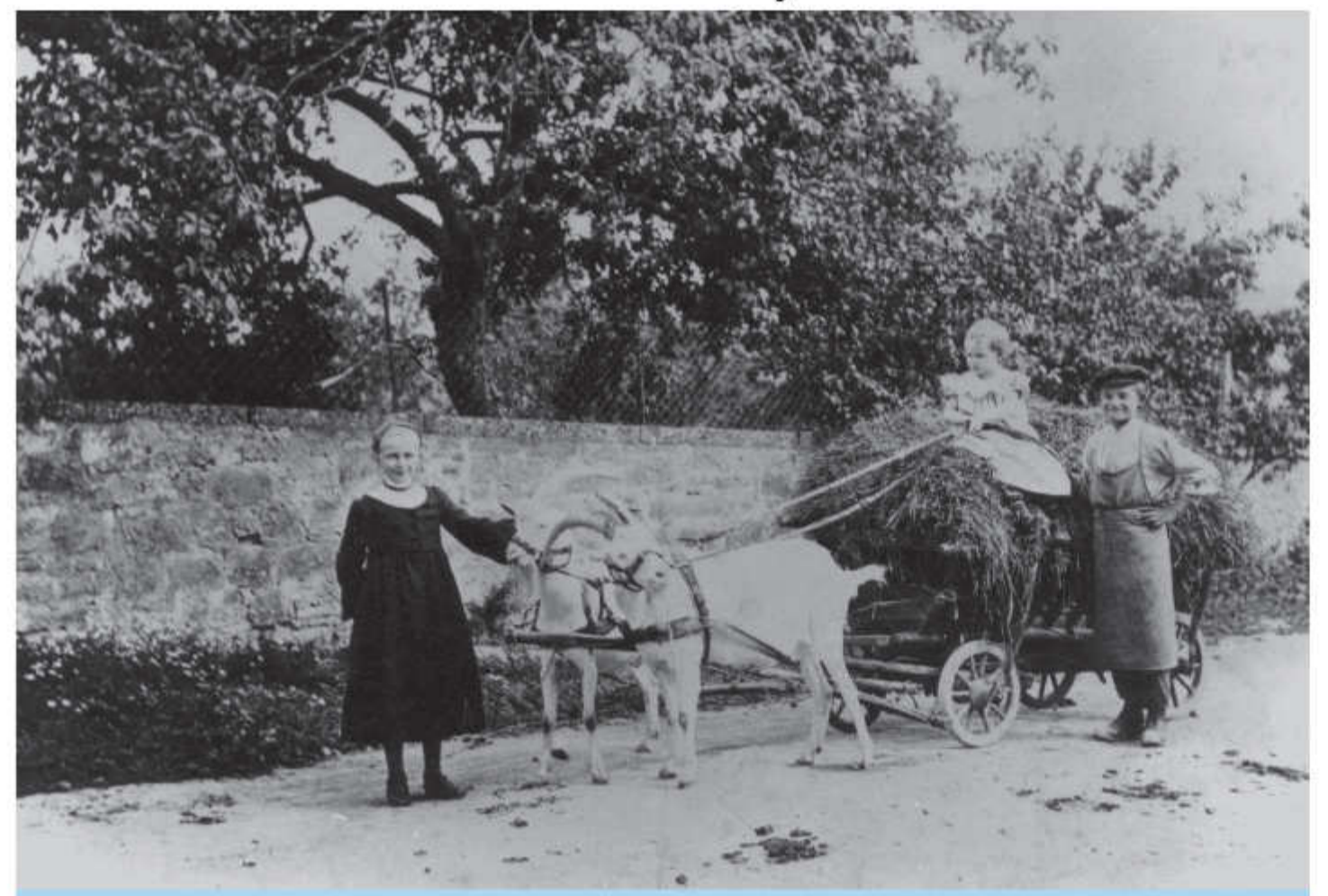
Mit diesen beiden Ziegenböcken wurde einst das Bier von Gramschatz nach Einsiedel gebracht.

Dann fehlen fast 200 Jahre lang Informationen. Erst 1731 erscheint Einsiedel wieder als Viehweideplatz. Über ein Gebäude wird 1860 berichtet, dass der vorhandene Bau um ein Stockwerk erhöht werden soll - und zwar durch Fachwerk mit Backsteinen ausgemauert. Der Platz vor der Hütte wird auf ca. 12 x 6 m gepflastert. Unter anderem werden dabei 12 Trinkgläser für Wein und 12 für Bier angeschafft sowie eine blecherne Tafel mit der Aufschrift „Waldhaus Am Einsiedel“. 1865 wird ein ca. 12 m tiefer Brunnen gegraben.