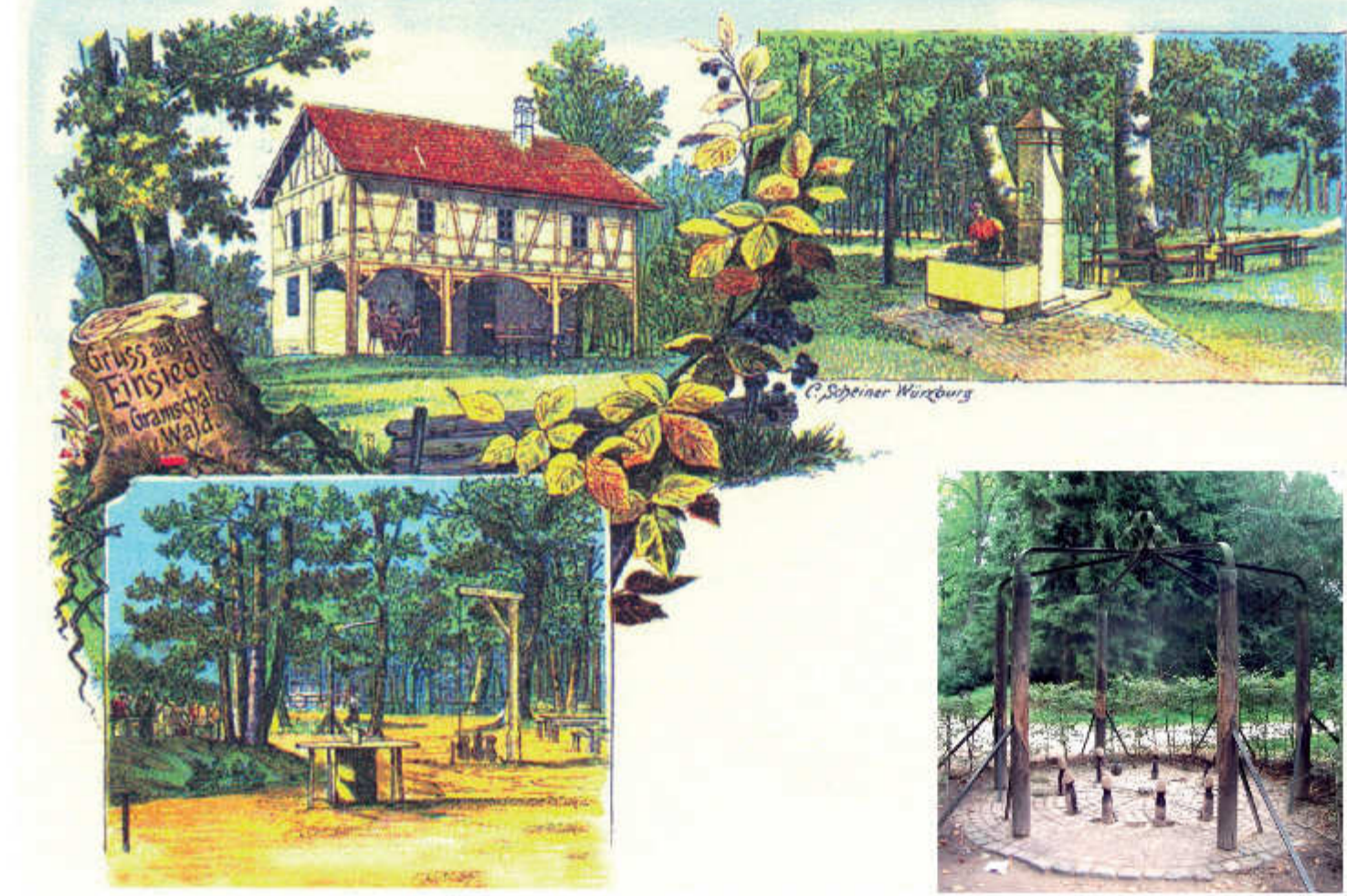
Postkarte des Waldhauses Einsiedel aus der Zeit vor dem 1. Weltkrieg. Seit 1892 gab es hier einen offiziellen Ausschank, der Brunnen wurde 1865 gebohrt. Unten sieht man einen Stehtisch und ein Kegelspiel mit einer an einem Galgen hängenden Kugel - rechts ein aktuelles Foto eines solchen Spiels aus dem Landschaftspark Schönbusch bei Aschaffenburg; unten ein Foto von Waldhaus und Brunnen aus den 1930er Jahren.

Landesfürstliche Forstverwaltung Würzburg Die Landesfürstliche Forstverwaltung Würzburg hat die Forstwirtschaft im Gramschatzer Wald seit 1892 übernommen und hat die Forstwirtschaft im Waldhaus am Einsiedel neu geordnet. Die Landesfürstliche Forstverwaltung Würzburg hat die Forstwirtschaft im Waldhaus am Einsiedel neu geordnet.