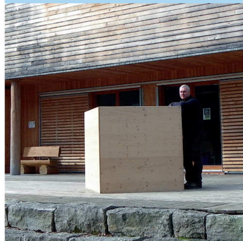
Am 21. Oktober 2007 eröffnete in der Nachbarschaft zum Waldhaus Einsiedel das Walderlebniszentrum Gramschatzer Wald. Das Walderlebniszentrum ist ganzjährig geöffnet. Im Gebäude erhalten Sie Informationen zu Wald, Holz- und Forstwirtschaft und auch zu nachwachsenden Rohstoffen und erneuerbaren Energien. Neben festen Ausstellungsstücken gibt es wechselnde Ausstellungen, Vorträge, Lesungen, Führungen zu waldwirtschaftlichen, waldökologischen und waldhistorischen Themen sowie waldpädagogische Angebote zum Mitmachen. Weitere Infos unter: www.walderlebniszentrum-gramschatzer-wald.de