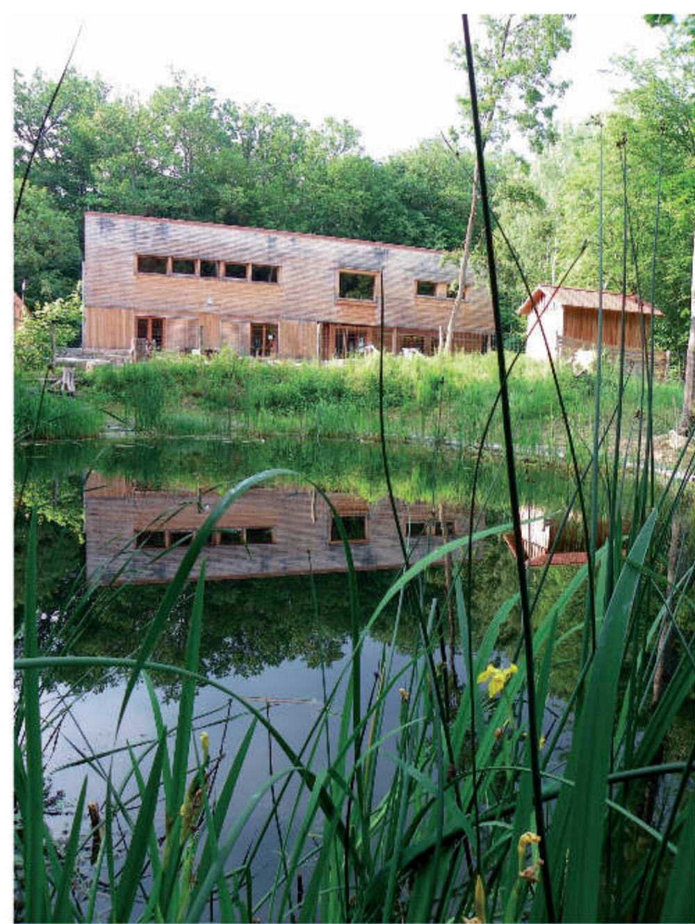
Das 2007 eröffnete Walderlebniszentrum bietet Aktivitäten im Außen- wie im Innenbereich. Unten: Soviel Holz wächst im Gramschatzer Wald in einer Stunde.

Eine Besonderheit vor Ort ist, dass 1969 hier der Film „Al-Capone im Deutschen Wald“ gedreht wurde, mit Rainer Werner Fassbinder als Schauspieler. Heute ist der Biergarten im Sommerhalbjahr geöffnet und wird von einem Pächter betrieben.