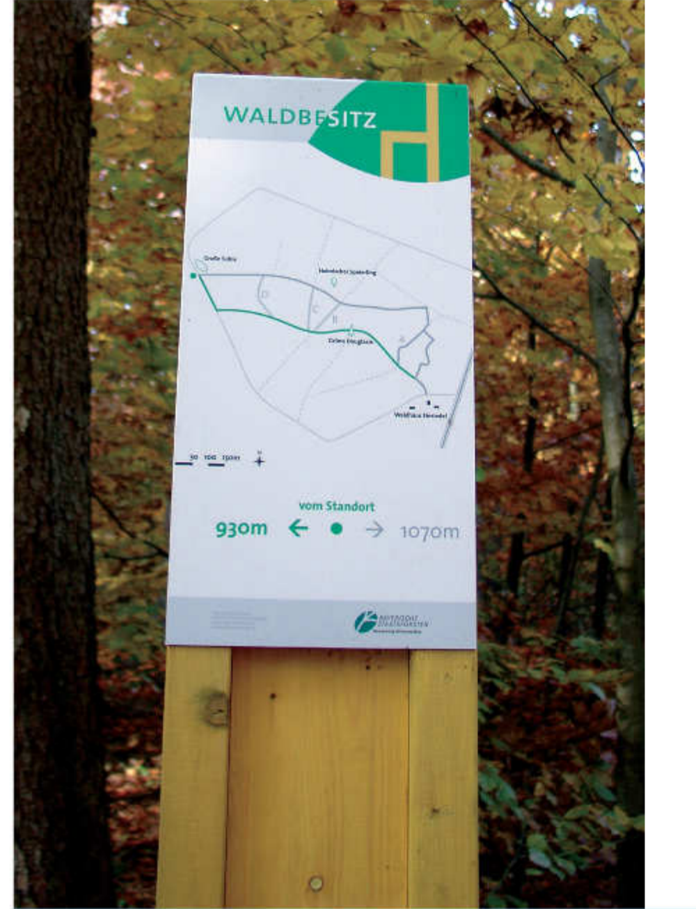
Der Kulturweg verläuft in Richtung Gramschatz zum Teil auf dem 2 km langen Rundweg Waldbesitz.

Am 21. Oktober 2007 eröffnete in der Nachbarschaft zum Waldhaus Einsiedel das Walderlebniszentrum Gramschatzer Wald. Das Walderlebniszentrum ist ganzjährig geöffnet. Im Gebäude erhalten Sie Informationen zu Wald, Holz- und Forstwirtschaft und auch zu nachwachsenden Rohstoffen und erneuerbaren Energien. Neben festen Ausstellungsstücken gibt es wechselnde Ausstellungen, Vorträge, Lesungen, Führungen zu waldwirtschaftlichen, waldökologischen und waldhistorischen Themen sowie waldpädagogische Angebote zum Mitmachen. Weitere Infos unter: www.walderlebniszentrum-gramschatzer-wald.de