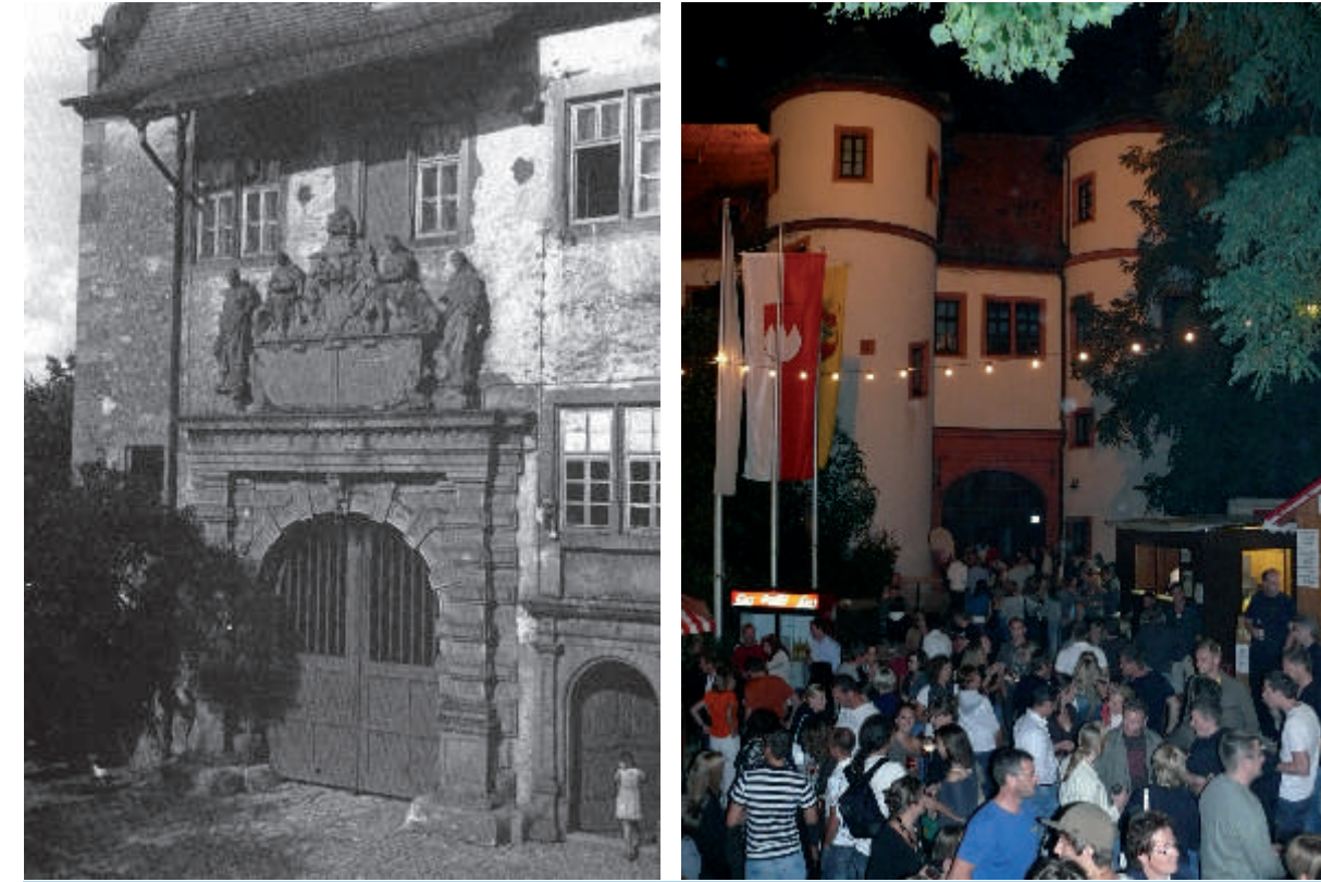
Die Aufnahme von 1928 zeigt das Tor zum Innenhof als Idyll mit Patina sowie von außen während des seit 1991 alljährlich Anfang August stattfindenden Schlossfestes.