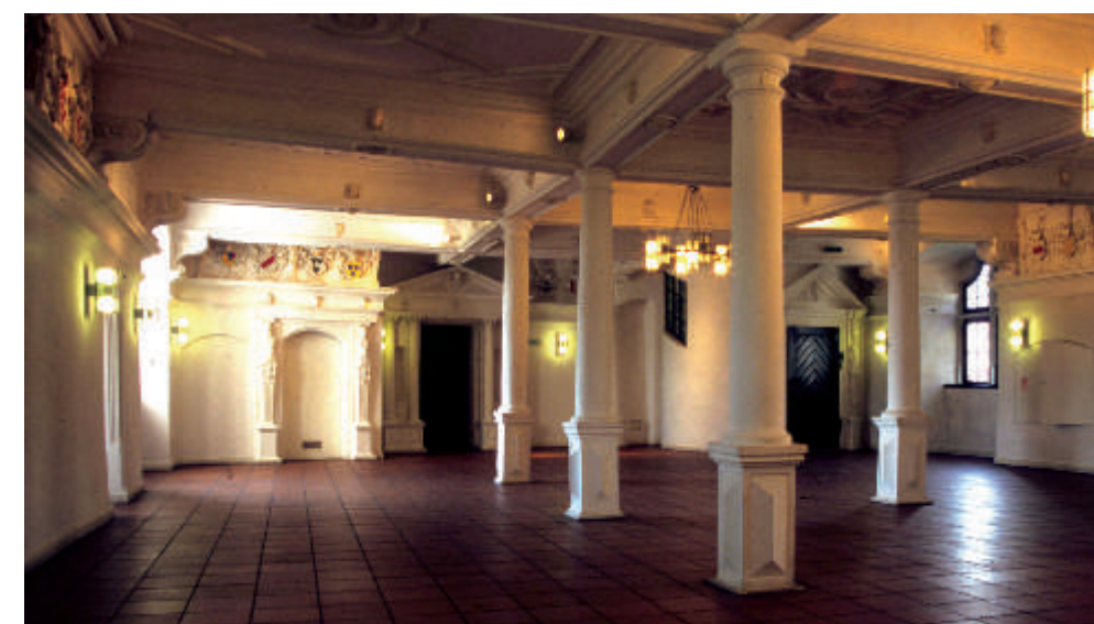
Im 16. Jh. wurde der Rittersaal mit Säulen und Stuck im Renaissancestil ausgeschmückt.

Im 16. Jh. wurde der Rittersaal mit Säulen und Stuck im Renaissancestil ausgeschmückt. Zwischen 1780 und 1793 wurden der Westflügel und die nördlichen Turmobergeschosse eingelegt. Den weiteren Abriss dürfte der Koalitionskrieg gegen die Franzosen verhindert haben. Um 1800 wurde das Schloss jedoch saniert, die welschen Hauben der Türme wurden durch Kegelhauben ersetzt. Von 1822 bis 1973, mit Unterbrechungen, war es Sitz des Forstamts Rimpar.