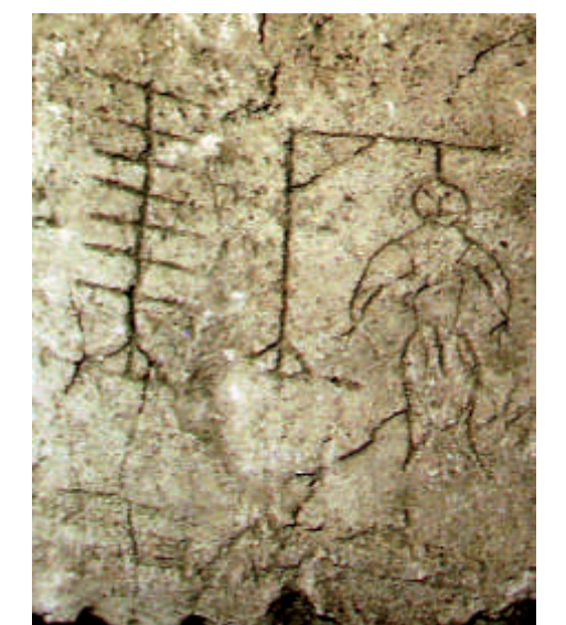
Gefangenen-Graffiti im Putz des Schlossgefängnisses