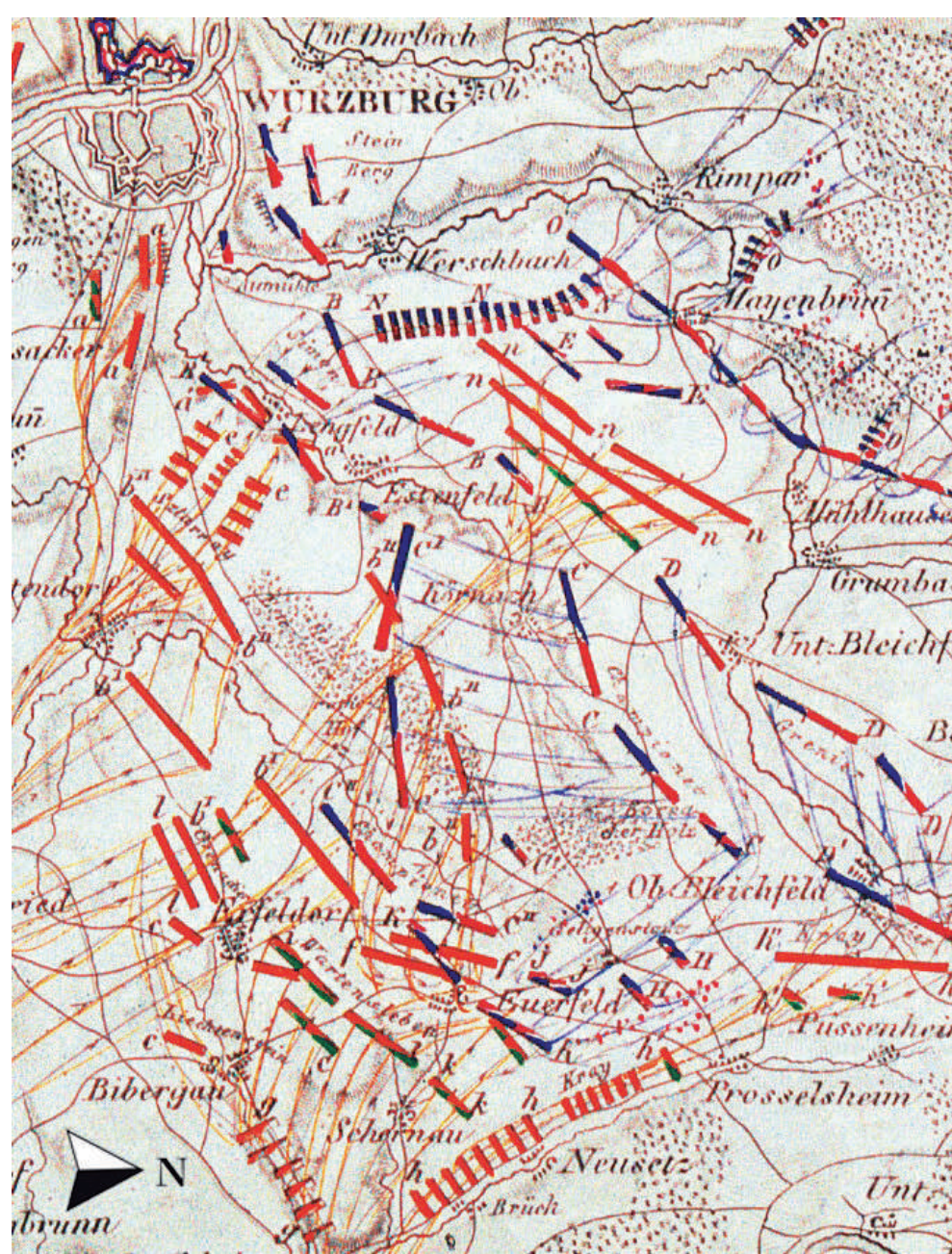
Französische Militärkarte (Norden ist rechts) der Truppenbewegungen während der Schlacht bei Würzburg am 3. Sept. 1796, mit der letzten Kampflinie südlich Maidbronn. Rot und grün: kaiserliche Truppen, blau: französische Truppen.

Die letzten Kämpfe fanden hier auf den Höhen südlich von Maidbronn statt. Die Franzosen flüchteten durch den Gramschatzer Wald. Der Sieg des Erzherzogs blieb jedoch nur eine Episode, die den weiteren Krieg wenig beeinflusste. Rimpar und Maidbronn litten nicht direkt in den Kampfhandlungen, wurden aber durch die Zwangsablieferungen von Lebensmitteln, Wagen und Zugtieren an beide Parteien stark in Anspruch genommen.