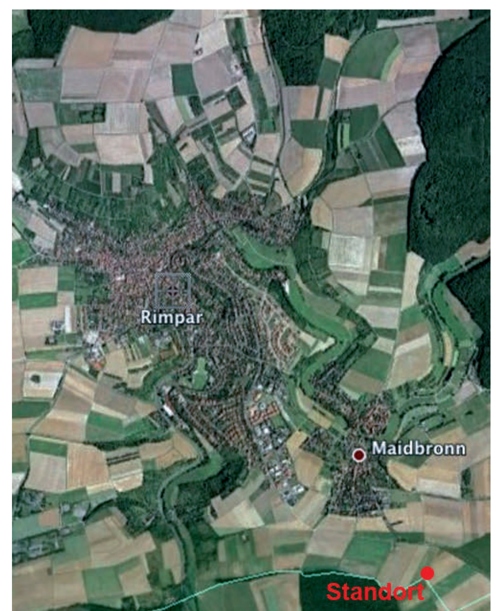
Luftbildkarten von Rimpar/Maidbronn 1935 und heute: die durch die fränkische Realerbteilung seit dem 18. Jahrhundert stark zerstückelte Flur im Gegensatz zu den heutigen großen Schlägen nach Flurbereinigung, Zukauf und Pacht.

Der heutige Anblick der Ackerflur ist jung, vom ersten Anstoß her das Ergebnis der Flurbereinigung, die in Rimpar von 1961-1966 durchgeführt wurde, in Maidbronn von 1956 bis 1966. Als Folge Jahrhunderte langer Realerbteilung – das Land wurde jeweils unter alle Erben aufgeteilt – war die Flur in eine Vielzahl schmaler, unwirtschaftlicher Grundstücke zersplittert. Im Mittel waren sie nur 0.3 ha, in Rimpar sogar nur 0.24 ha groß, wie das Luftbildmosaik von 1935 zeigt.