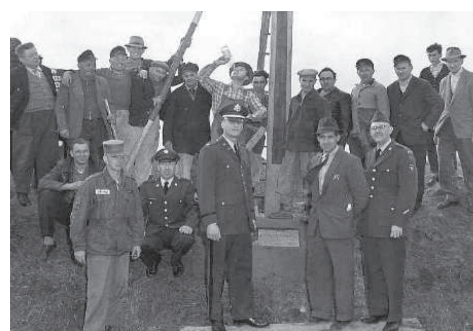
1957 wurde mit Unterstützung der U.S.Garnison in Würzburg ein Ersatzkreuz für das 1921 vom Sturm zerstörte alte Holzkreuz aufgerichtet (oben), aber bereits 1960 nach der Verlegung der Estenfelder Straße durch das heutige Betonkreuz ersetzt (unten).