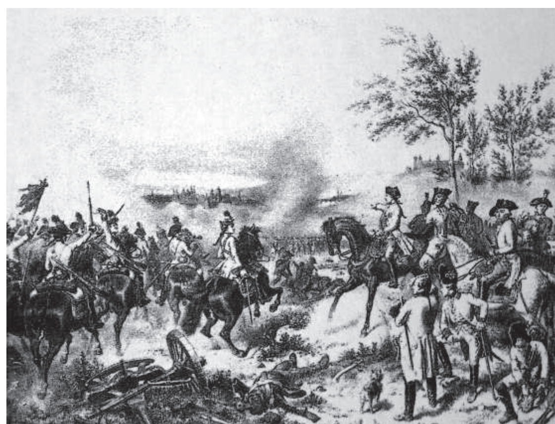
Erzherzog Karl während der Schlacht.

Auf der ersten Kartenaufnahme des Gebiets 1832 wird die Flur „Am Hohen Kreuz“ genannt. 1957 wurde unter der Teilnahme amerikanischer Offiziere ein Nachfolgekreuz errichtet, das im Zuge der Straßenverlegung aber bereits am 28. Okt. 1960 vom damaligen Maidbronner Verein für Heimatpflege durch das jetzt noch vorhandene Betonkreuz ersetzt wurde.