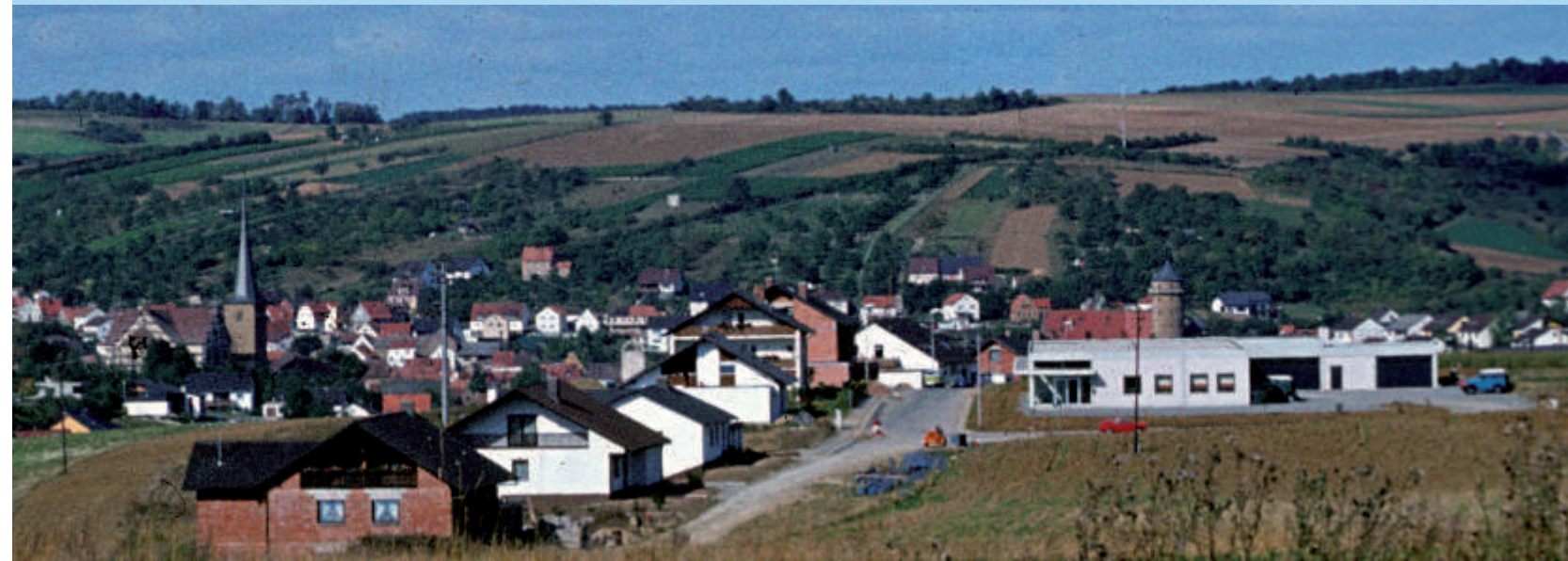
... um 1975 mit den Anfängen des Gewerbegebietes...