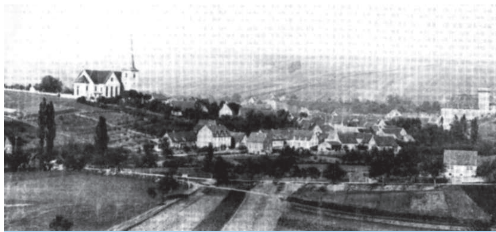
Blick auf Rimpar von Süden um 1900 ....

Der knapp 200 m hohe Scheuerberg bietet von Süden einen guten Überblick über Rimpar. Dahinter sieht man den Anstieg zum Gramschatzer Wald mit dem Großen Leimig (ca. 350 m Höhe). Der Scheuerberg wurde 1719 gerodet und erstmals mit Getreide eingesät. Neben der Landwirtschaft und den Mühlen im Pleichachtal waren Ziegelhütten und Kalkbrennereien weitere