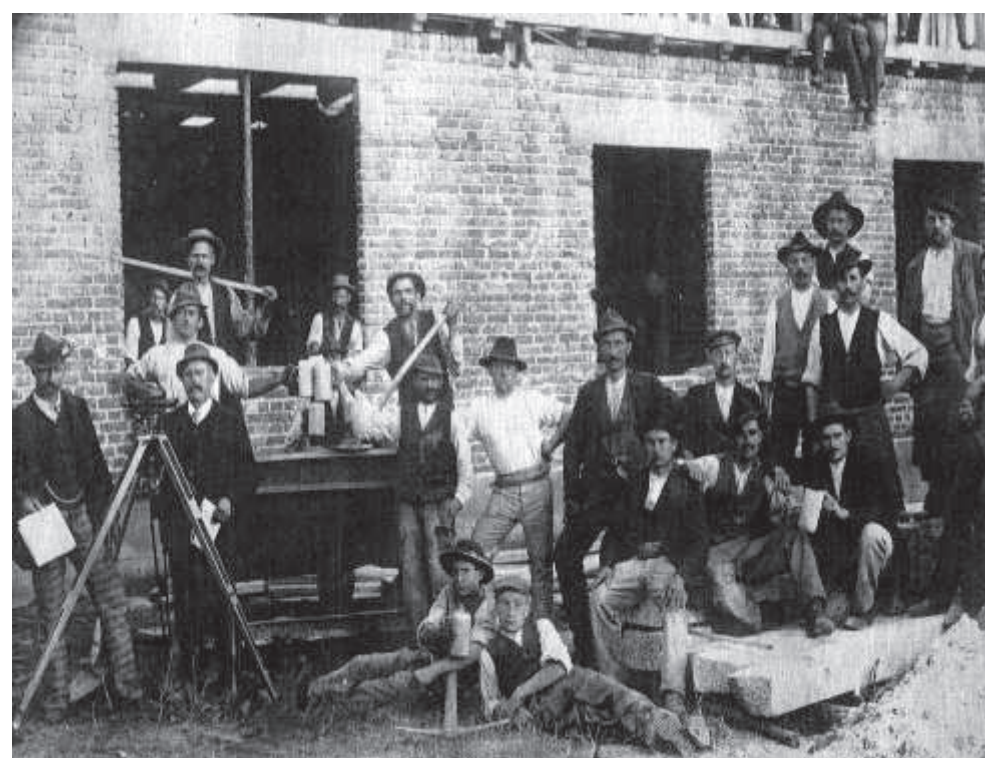
Rimparer Maurer auf Baustellen in den 1930er Jahren

Am 21. Sept. 1921 fanden beim Bau einer Stickstoffdüngerfabrik der BASF in Oppau bei Ludwigshafen am Rhein bei einer schweren Explosion unter anderem auch sieben Rimparer Maurer den Tod (siehe Tafel Kirche in Rimpar).