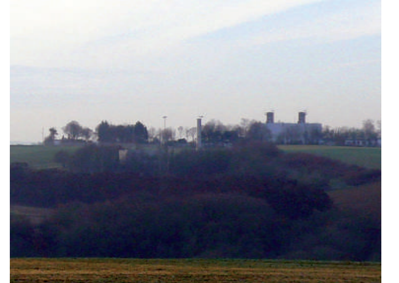
Oben: Einer der Rimparer Gasverdichter Mitte: Blick in das Innere der Anlage

Die Anlage in Rimpar hat ein Leistungsvermögen, das bei voller Auslastung ein Viertel des in Deutschland benötigten Gases transportieren könnte.