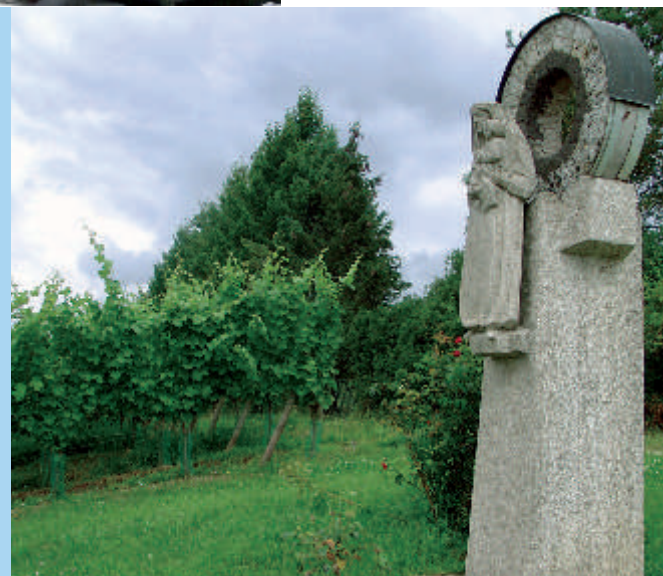
Rechts: Die „Weinbergmadonna“ bei der Veitsmühle.