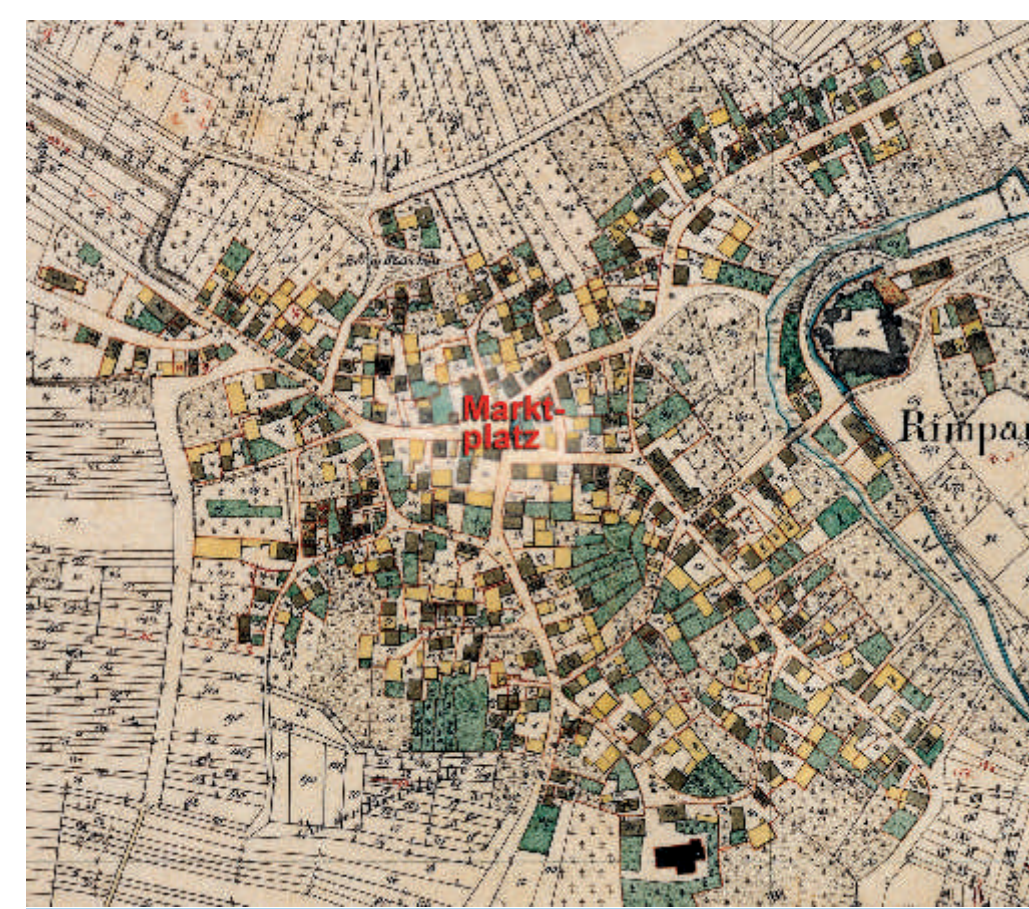
Die historische Ortskern von Rimpar 1832

Die Marktgemeinde Rimpar mit ca. 8000 Einwohnern (2010) entstand 1978 im Zuge der bayerischen Gebietsreform durch die Eingemeindung von Maidbronn und Gramschatz. Als Siedlungsplatz bestand Rimpar schon in der Jungsteinzeit, vor etwa 5000 Jahren. Rimpar und Gramschatz dürften schon während der fränkischen Landnahme um 600 n. Chr. entstanden sein, für Maidbronn ist das genaue Gründungsdatum 1232 als Benediktinerinnenkloster Fons Virginis bekannt.