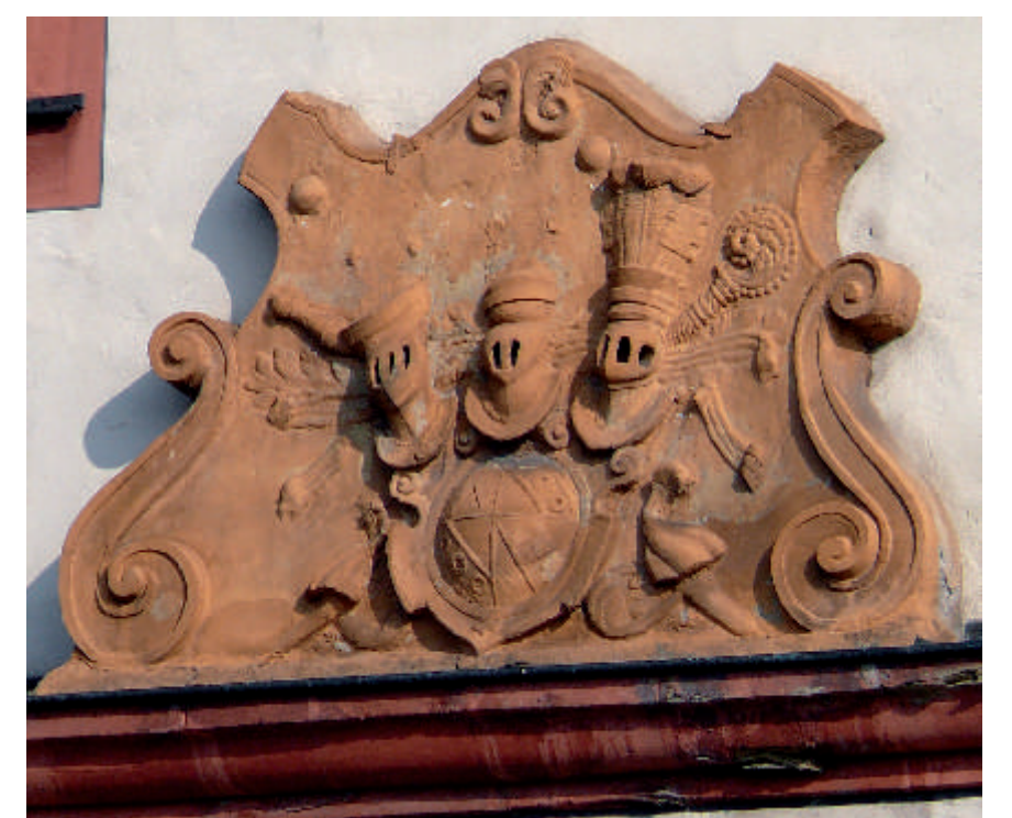
Das Gasthaus Stern war das ehemalige Rathaus von Rimpar, heute noch am fürstbischöflichen Wappen zu erkennen.