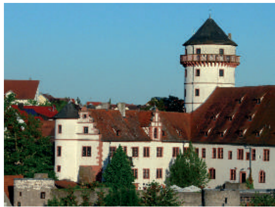
Der Kulturweg verbindet Rimpar mit Schloss Grumbach (oben) und den Ortsteil Maidbronn mit dem ehemaligen Kloster (unten).