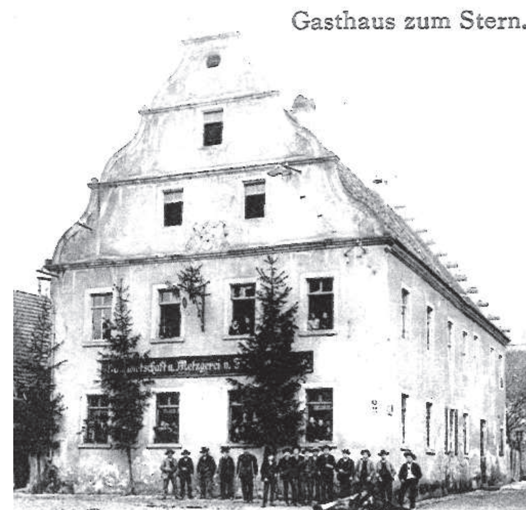
Gasthaus zum Stern.