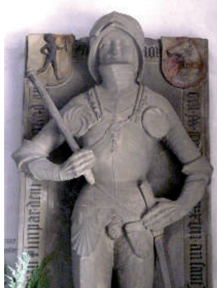
In der Rimparer Kirche befindet sich das erste (links) und im ehemaligen Kloster Maidbronn das letzte (rechts) Steinbildwerk Riemenschneiders.

Der Kulturweg zeigt anschaulich, wie Kulturlandschaft früher beeinflusst wurde - hier durch Wasserbau und durch die Gründung eines Klosters - und erläutert, wie der Mensch heute die moderne Umwelt gestaltet - z.B. durch Gewerbegebiete.