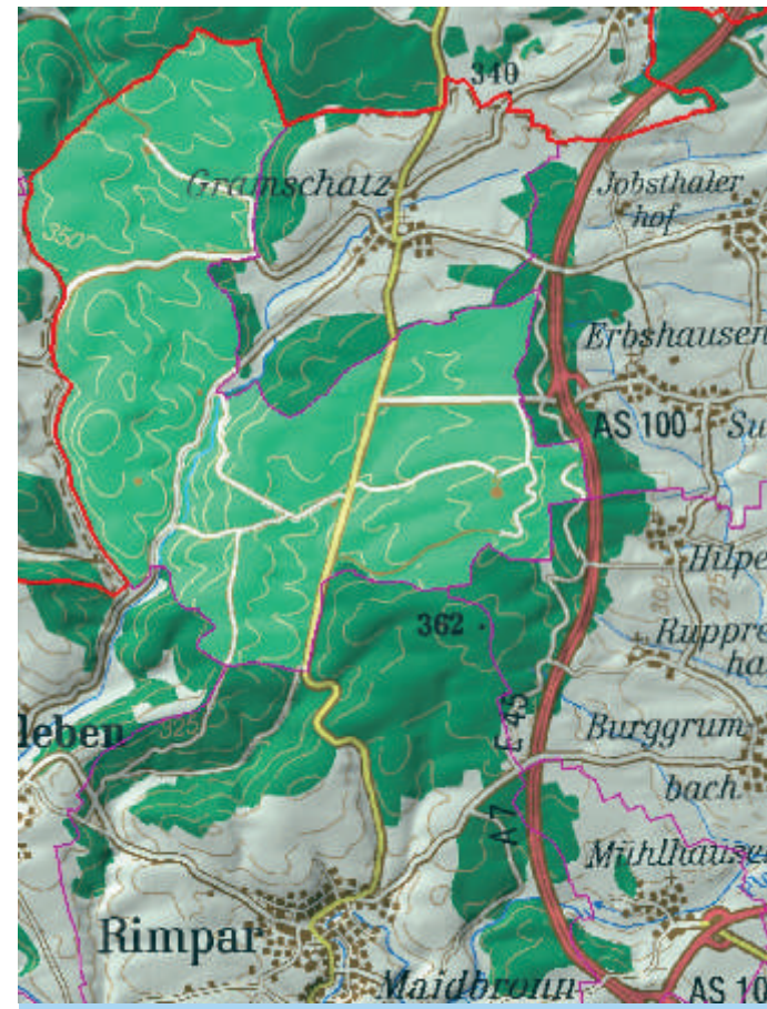
Der Gramschatzer Wald teilt sich in einen staatlichen (hell) und in einen gemeindlichen (dunkel) Teil.

leitet seinen Namen vom Ort Gramschatz ab, der 772 erstmals genannt wird und heute ein Ortsteil von Rimpar ist. Kaiser Heinrich II. schenkte den Forst 1015 dem Würzburger Bischof. Seit dem 15. Jahrhundert weiß man von Forstmeistern, die den Wald betreuten. Unter ihnen nahmen die Herren von Grumbach seit 1409 die Vormachtstellung ein. Rimpar wurde zum Verwaltungsmittelpunkt des Gramschatzer Waldes bis zum Jahr 1569, als die Familie nach den „Grumbachschen Händeln“ den Wald und 1593 Schloss Grumbach in Rimpar an den Würzburger Bischof verkaufen musste. Seit dieser Zeit verwalten staatliche und gemeindliche Forstbetriebe den Wald.