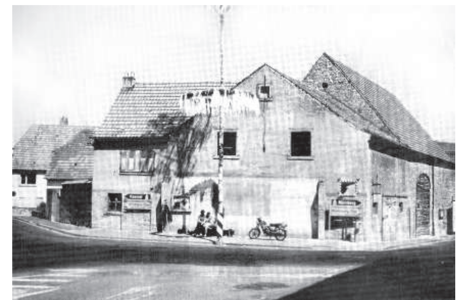
Der „Marktplatz“ ist eigentlich die wichtigste Straßenkreuzung in Rimpar - hier auf einem Foto von 1967.

Die älteste urkundliche Erwähnung von Rintburi (= Rinder“bauer“, also Ort am Rinderstall) stammt aus ei-