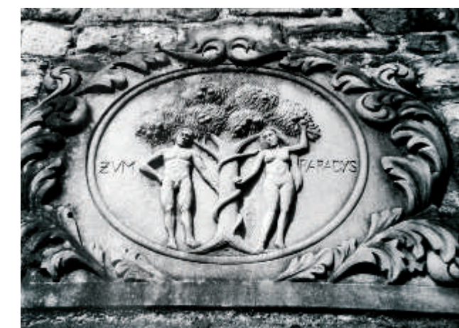
Das Paradieshäuschen um 1900; oben mit der barocken Kartusche; unten aktuell die restaurierte Figuren-Plakette ohne den barocken Rahmen.

Die für Gelnhäuser Wingerthäuschen untypisch aufwändig gestaltete Bedachung zeigt drei Dachhäuschen, nach Süden, Osten und Westen orientiert. Sie weisen je eine große kreisrunde Fensteröffnung auf, einen so genannten Okulus. Das Dachgesims ist im Stil des Klassizismus durch zur Dachkante gerichtete schmale Stäbe untergliedert, in deren Zwischenräumen jeweils eine Rosette sitzt.