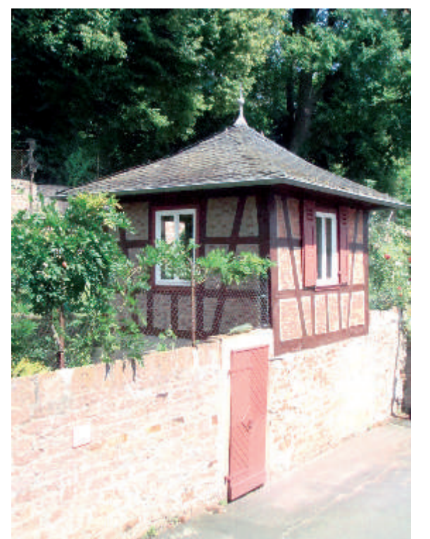
Zwei weitere erhaltene Wingerthäuschen finden sich in der Nähe „Am Stephanusberg“, dem Verbindungsweg zwischen dem Stadttor „Inneres Holztor“ und der Ober-Haitzer-Gasse.