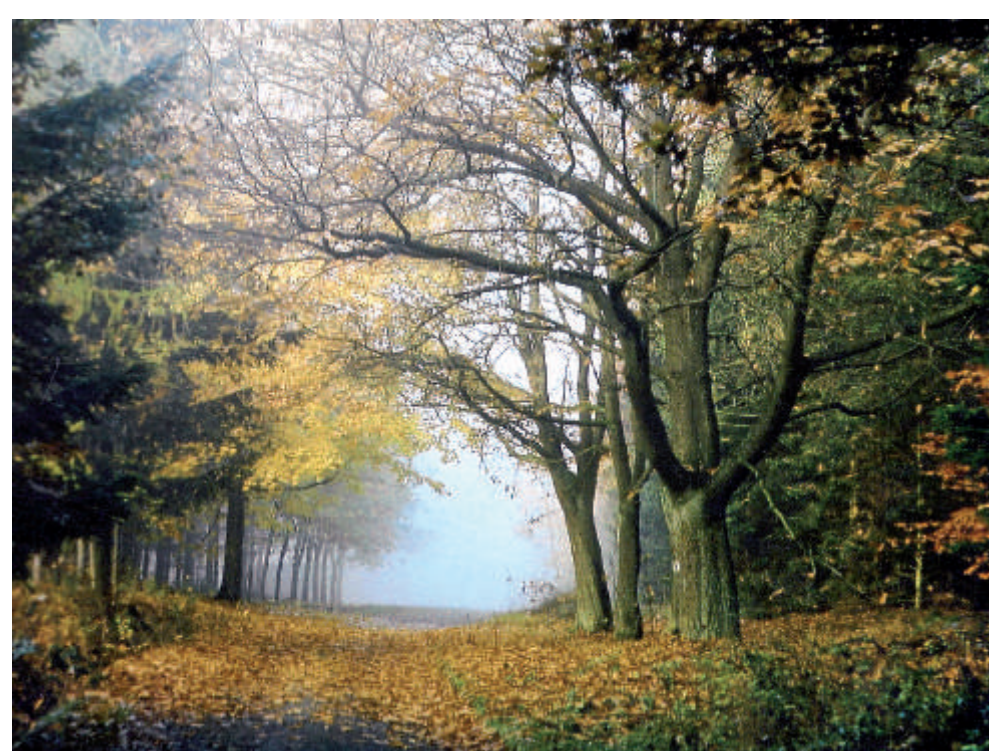
Die Nordschleife führt durch den Wald mit dem Zollloch (links) und mit Schülerborn, Hügelgräbern und Schulfestplatz (rechts).