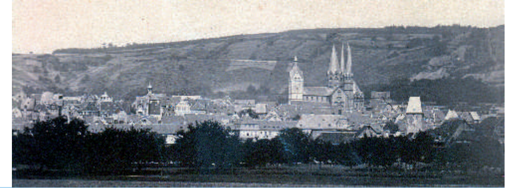
Gelnhausen mit seinen Weinbergen auf einer kolorierten Zeichnung und auf einem Foto, aufgenommen vor 1877, mit dem noch verdrehten schiefen Turm