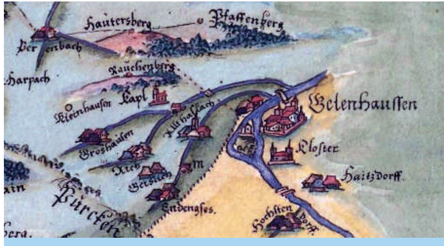
Auf der Spessartkarte des Paul Pfinzing von 1562/94 ist Gelnhausen mit seinen südlichen Stadtteilen zu erkennen.

Oberhalb der sehenswerten Altstadt erschließt sich die Kulturlandschaft Gelnhausens als eine reichhaltige Ansammlung von Relikten vergangener Weinberg- und Waldkultivierung. Über Jahrhunderte hinweg war der Weinbau in Gelnhausen von größter Bedeutung, bis er um 1900 zum Erliegen kam. Seit Beginn des 21. Jahrhunderts wird an diese alte Tradition wieder angeknüpft. Die in den ehemaligen Weinlagen in der zweiten Hälfte des 19. Jahrhunderts entstandenen Prachtbauten des Bergschlösschens und der Weißen Villa sind den Handelsfamilien Schöffner und Becker zu verdanken.