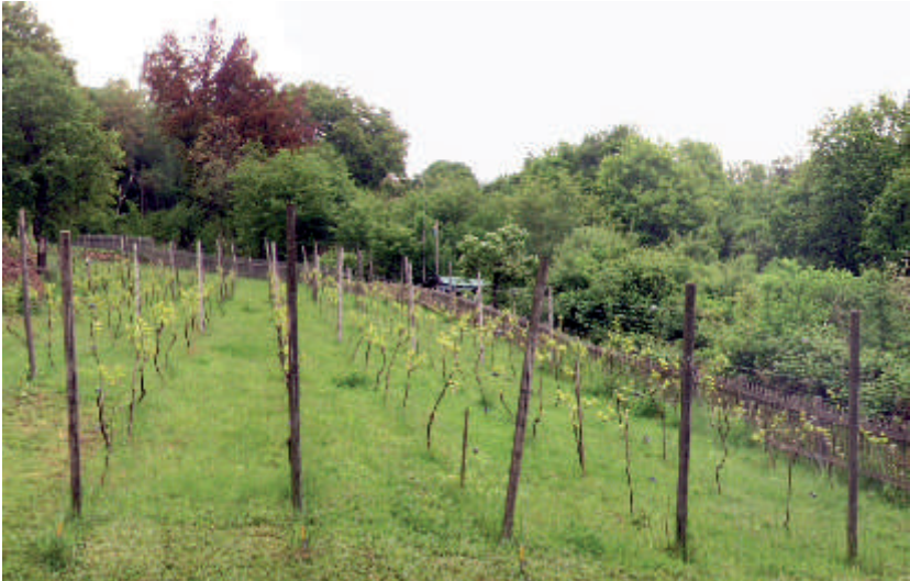
Die südliche Schleife führt durch die Gelnhäuser Weinberge bis zum Bergschlösschen mit der Geschichte der Familien Schöffner und Becker sowie des Gelnhäuser Kurbetriebes.