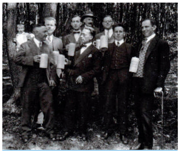
Die Gelnhäuser Bürger feiern seit dem 19. Jh. oberhalb der Stadt ihre „Waldpartien“ - hier um 1935, Nähe Blockhaus.

Im Gelnhäuser Wald feierten die Bürger ab der gleichen Zeit die so genannten Schülerfeste und Waldpartien, die von der gesamten Stadtbevölkerung begeistert gefeiert wurden. Darüber erzählen die Stationen Schülerborn, Schulfestplatz und Heinrichshöhe. Auch der Gedenkstein für Friedrich Schiller nahe der Heinrichshöhe geht auf städtische Initiative zurück.