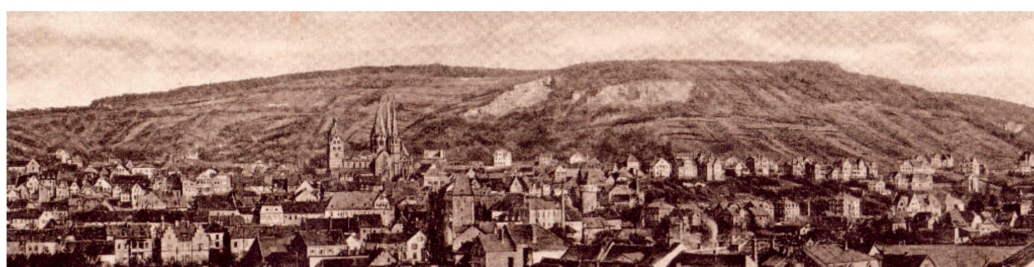
Gelnhausen und seine Weinberge um 1900

Schon kurz nach der Stadtgründung 1170 wird urkundlich Besitz von Weinbergen der Klöster Meerholz und Selbold in Gelnhausen erwähnt. Die ältesten Weinkulturen dürften sich am Königsstück auf dem Hang nördlich der Kaiserpfalz, auf dem Alten Berg, der Dürich am Dietrichsberg und auf dem Alten Graben befunden haben.