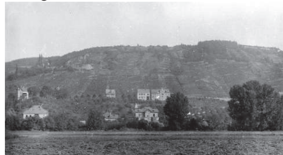
Blick von der Kinzigau hinauf auf die Gelnhäuser Weinberge um 1920

Exporte bis an den Wiener Hof sprechen für sich. Gelnhäuser Wein war überregional bekannt und beliebt. „In Gelnhausen findet man firne Weine von großem Reichtum an Geist und Mark“ beschrieb das „Weinbuch“ von 1874. Sorten wie Weißer Elbling, Weißer kleiner Riesling, Gelber Ortler, Grüner Silvaner, Roter und Schwarzer Cläver wurden angebaut.