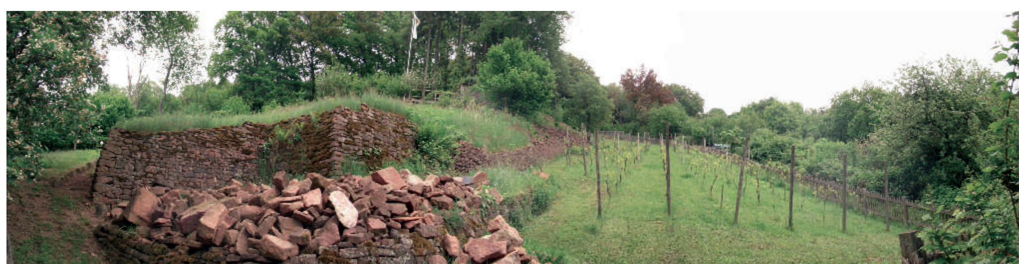
Am Pfaffenweg wird Weinbau seit dem 21. Jahrhundert wieder gepflegt.

„Obendig Gelnhausen liegt ein schöner hoher großer Weinberg, da wechst viel und guter Wein“. (Erasmus Alberus, 1550)