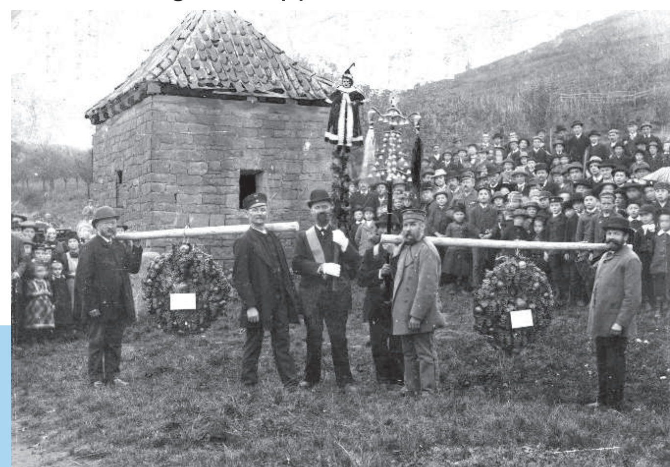
Das „Orwanesi“ wurde zum Abschluß der Weinlese in einer Prozession durch die Stadt getragen.

Shortly after the town's foundation in 1170, it is documented that the monasteries in Meerholz and Selbold possessed vineyards in the Gelnhausen area. The oldest one is thought to be the Königsstück (King's Plot) on the slope north of the Imperial Palace. At that time, wine was consumed every day by the general public, because it was purer than water. Rich citizens put their money into vineyard properties. Gelnhausen wine was so popular that members of the imperial family in Vienna also drank it. «In Gelnhausen you find fine wines of great richness of spirit and marrow», claimed «Das Weinbuch» in 1874. On the last day of the annual vintage, the «Orwanesi» was carried through the town in a beautifully decorated pageant. This late Gothic wooden statue of St. Urban represents the patron saint of winegrowers. The winegrowers gave thanks for a good harvest and asked that the next season should give a good yield. Climate fluctuations, wars, and inheritances caused the decline of wine cultivation in Gelnhausen. Industrialisation and the railway meant that, by the end of the 19th century, wine growing had come to a standstill. Thereafter, the former wine-growing areas were redeveloped for fruit growing. One of the last vintages, in 1897, is documented in photographs.