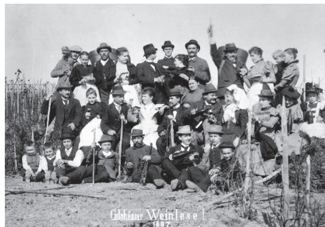
Eines der wenigen Fotos von der Weinlese in Gelnhausen am Ende des 19. Jahrhunderts

Zum jährlichen Abschluss der Weinlese wurde in einem prächtig geschmückten Festzug das „Orwanesi“ durch die Stadt getragen. Diese spätgotische Holzfigur stellte St. Urbanus dar, den Schutzheiligen der Weinbauern. Die Winzer dankten für die Ernte und baten für die kommende Saison um guten Ertrag. Klimaschwankungen, Kriege und Erbteilungen erschwerten das Auskommen der Weinbauern ab dem 18. Jahrhundert. Der Beitritt Kurhessens zum deutschen Zollverein 1834 erleichterte die Einfuhr auswärtiger Weine, Arbeitskräfte wanderten in die aufstrebende Industrie ab.