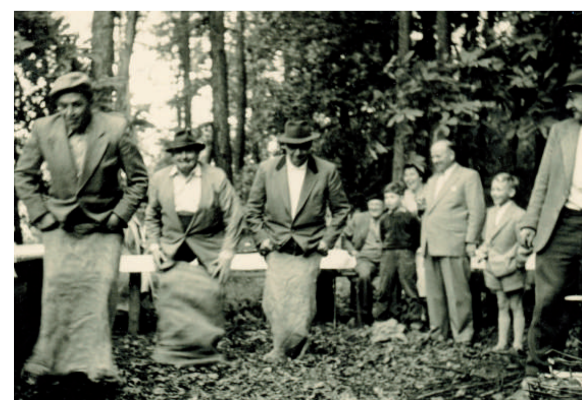
Sackhüpfen war ein fester Bestandteil der Waldpartien - oben 1955 auf der Heinrichshöhe, unten 1968 auf dem Schulfestplatz.

Durch den Verkehrsverein wurde die Anlage mit Turmweihe und Konzert am 14. Juni 1914 unter großer Beteiligung der Bevölkerung sowie zahlreicher Musik- und Gesangsdarbietungen feierlich eröffnet.