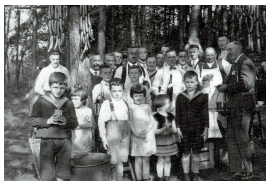
An der Heinrichshöhe hingen die Würste beim Schulausflug in den Bäumen.