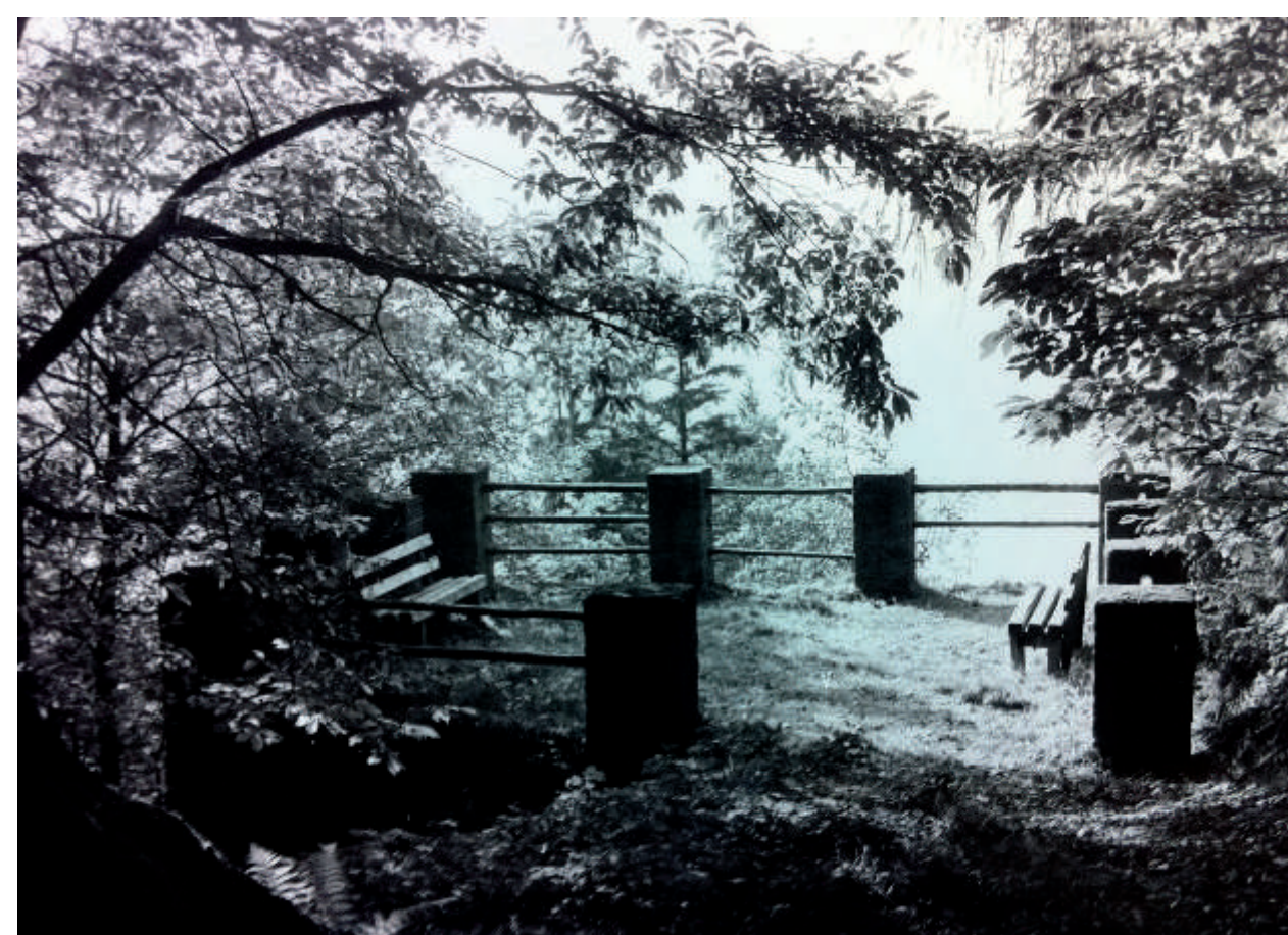
Nach dem 2. Weltkrieg war ein Ausblick vom Fundament des Aussichtsturms noch möglich. Heute (2014) kann man nur noch im Winter auf die Stadt blicken.