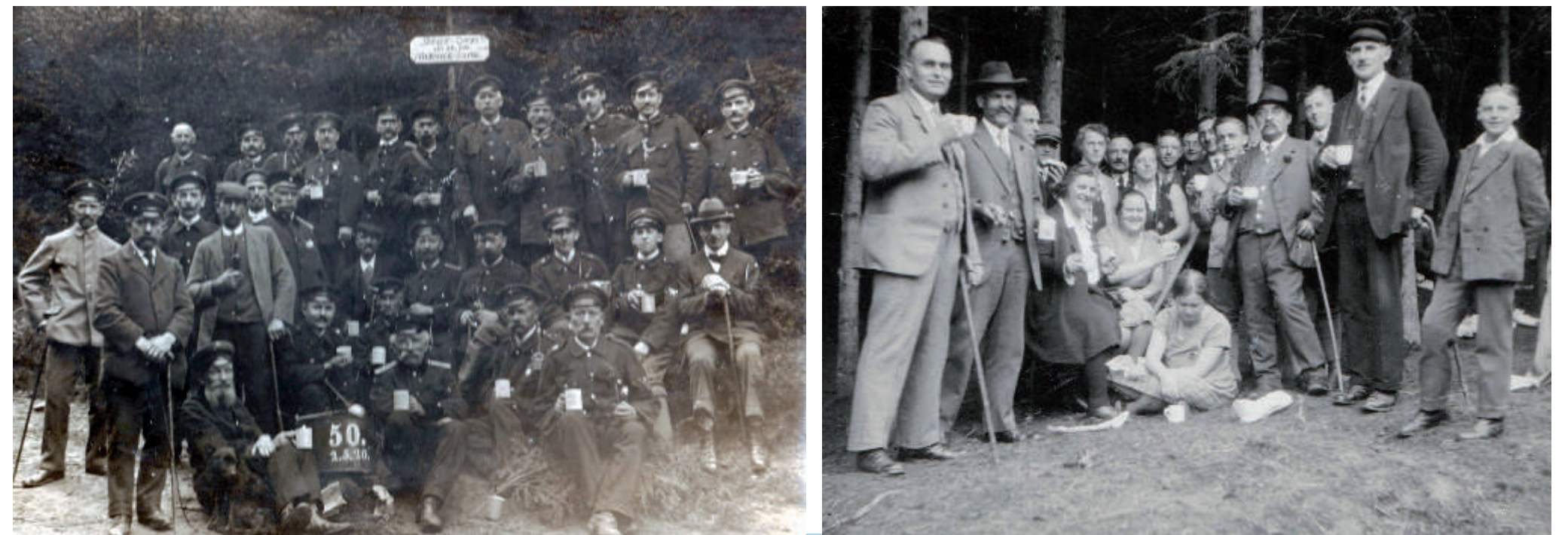
Die Frühpartie zum 50-jährigen Jubiläum der Steiger 1920 und eine Gruppe von ca. 1925

Heute beginnt die Frühpartie der Feuerwehr um 7 Uhr am Schülerborn traditionell mit dem Kaffeekochen. Dazu werden Rühreier und für die Süßmäuler Ladwerchebrot gereicht, bis gegen halb zwölf an gleicher Stelle Schluss ist.