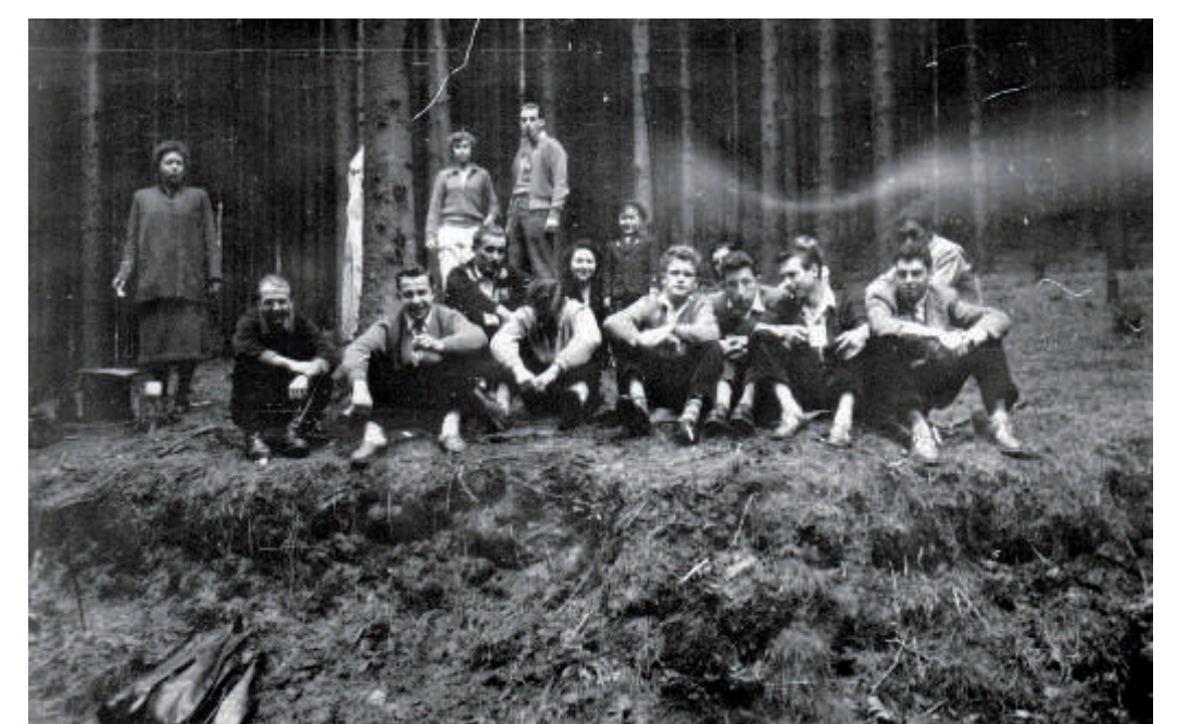
Generationen von Gelnhäusern verbrachten eine Frühpartie am Schülerborn - dabei eignete sich immer wieder der Abhang oberhalb des Platzes für Gruppenfotos.

Maybe a legend? In 1632, during the Thirty-Years' War Gelnhausen people, who were on the run, came here and drunk water to survive because the Swedes besieged Gelnhausen. The spring tapping of the «Schülerborn» dates 1614. More than 200 years later on, the Gelnhausen firefighter came to this location. They started in town on Sundays at 6 o'clock in the morning, went through the Dürich ravine, the Toll-Hole and Maarberg to the Schülerborn. Here they boiled fresh water for coffee. In most cases, a baker had agreed to bake fresh bread. After singing together they made a nice walk to various destinations. Later on they walked to the school festival ground – and at latest 12 o'clock the «Early Forest Party» finished due to forest dormancy. Therefore all participants wandered to the Block-House or to Mother Eberling in Gettenbach village for eating home made platters.