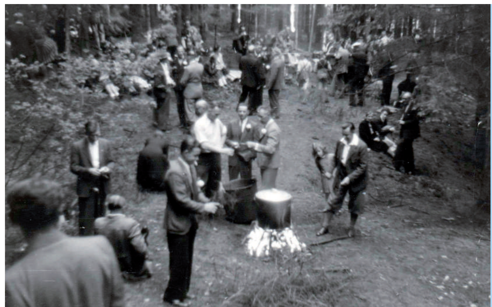
Den besten Einblick in eine Frühpartie am Schülerborn gibt dieses Foto aus dem Jahr 1955.