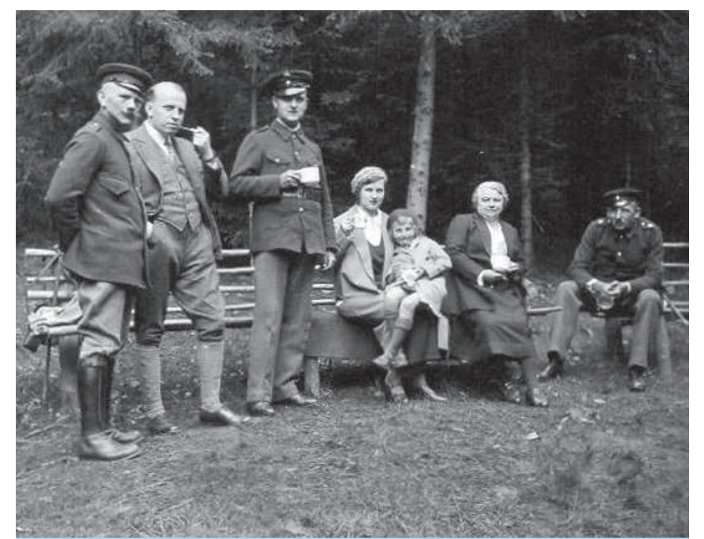
Die Feuerwehr am Schülerborn um 1930

... FrISCHE Brötchen, Spiegeleier, warme Würstchen, gar nicht teuer, Schnaps und Cognac, ach oh Schreck, Erbsensuppe mit viel Speck, Bohnenkaffee, Limonade, Jägermeister, Orangeade, Bier und Wein, Likör und Sprudel Hundekuchen für den Pudel, warme Milch fürs Miezekätzchen, und für die Kleinen Zuckerplätzchen.