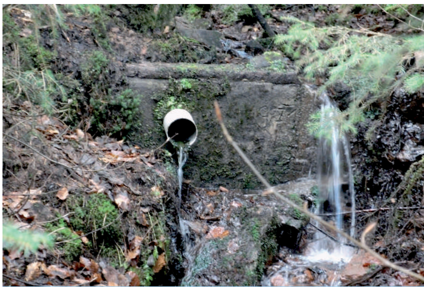
1971 wurde der Bachlauf am Schülerborn neu gefasst.