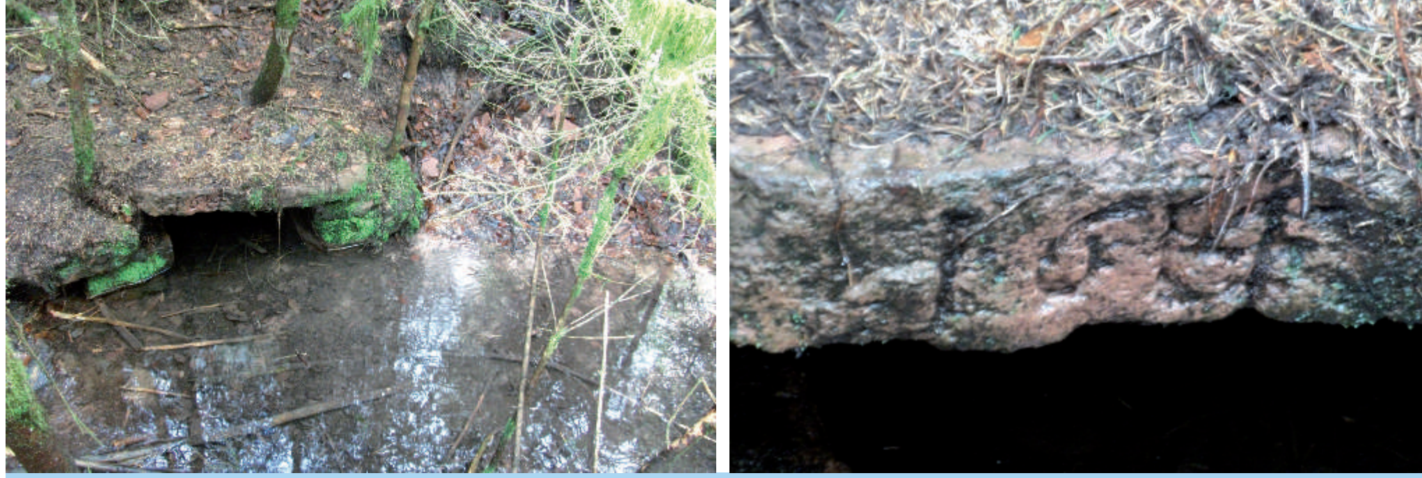
Oberhalb in einer unzugänglichen Abteilung des Waldes liegt die Quelle des Schülerborns. Auf dem Brunnenstein ist die Jahreszahl 1614 zu lesen, vier Jahre vor Beginn des 30jährigen Krieges.

Die Herkunft des Wortes „Schülerborn“ hat wahrscheinlich nichts mit „Schülern“ zu tun (die Verbindung könnte durch die Gelnhäuser Schulfeste hergestellt worden sein), sondern geht auf den noch nicht gedeuteten Namen „Scheulerborn“ zurück.