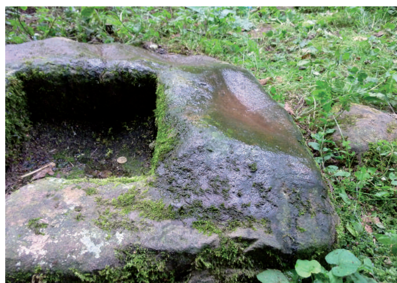
Der Zollochstein in Nahaufnahme. Rechts eine vermutlich durch Wetzten eingetiefte Schleifmulde.

oder „Lochsteine“ markierten früher die Grenzen von Territorien.