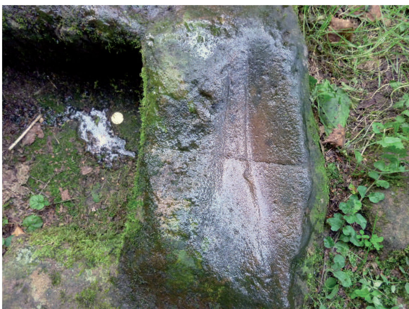
Die große Schleifmulde im Zollochstein im Detail

Das Wort „Grenze“ kommt aus dem Slawischen und fand erst seit dem 16. Jahrhundert in der deutschen Sprache Verwendung. Rätselhaft sind die offensichtlichen Schleifspuren von menschlicher Hand auf der Oberfläche und am äußeren Rand.