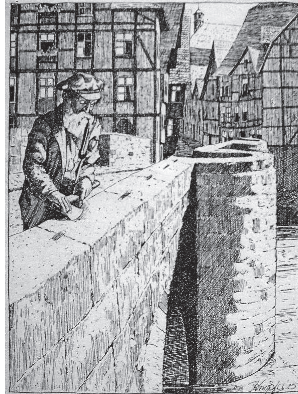
Wenn auf der alten Brück' ich steh' und seh' der Alten Art, Wie sie gewest am Bordstein eh' die stumpfgeword'ne „Bart“. Dann bin ich stolz, daß man mich nennt den „Bartenwetter“ nur. So noch in spä'trer Zeit erkennt das Kind der Väter Spur. Aus „Bartenwetterlied“ von Paul Woidke, komponiert von Bruno Leipold. Verlegt bei A. Bernegger, Heimschollen-Verlag, Melsungen

Wie in Melsungen an der Bartenwetterbrücke könnten die Waldarbeiter an diesem Stein ihre Axtschneiden (Barten) geschärft haben; oder: