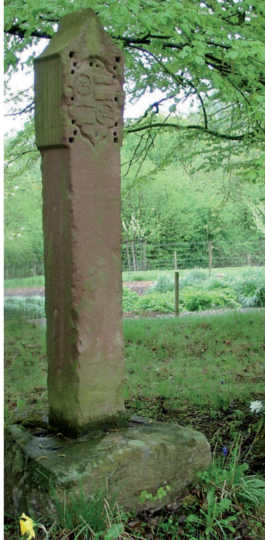
Einer der ältesten Zollstöcke im Spessart steht zwischen Rieneck und Gemünden

Alte Gelnhäuser erzählen von einem Brauch: Wenn sie mit einem Korb Heidelbeeren hier vorbeikamen, legten sie den Waldgeistern einen Tribut (Zoll) in Form von einigen Beeren ins Loch. Sonst liefen sie Gefahr, dass die Waldgeister ihnen auf der Dürich (dem steilen Hohlweg hinab in die Gelnhäuser Altstadt) ein Bein stellten und ihre Heidelbeeren den Berg hinunter kullerten. Dieser Brauch könnte darauf zurückgehen, dass hier früher Zoll erhoben wurde. Beim Zolloch handelt es sich vermutlich um die Basis eines verloren gegangenen Bild- oder Zollstocks, der früher an dieser Wegekreuzung stand. Schon vor Jahrtausenden verlief hier eine Handelsstraße, die wahrscheinlich von einer zweiten gekreuzt wurde. Bislang wurden keine schriftlichen Quellen gefunden, ob im Mittelalter hier eine Zollstation vorhanden war. Zollstöcke wurden an Handelsstraßen bis etwa in die Mitte des 18. Jahrhunderts aufgestellt, nicht nur an Grenzen, sondern auch an strategischen Stellen.