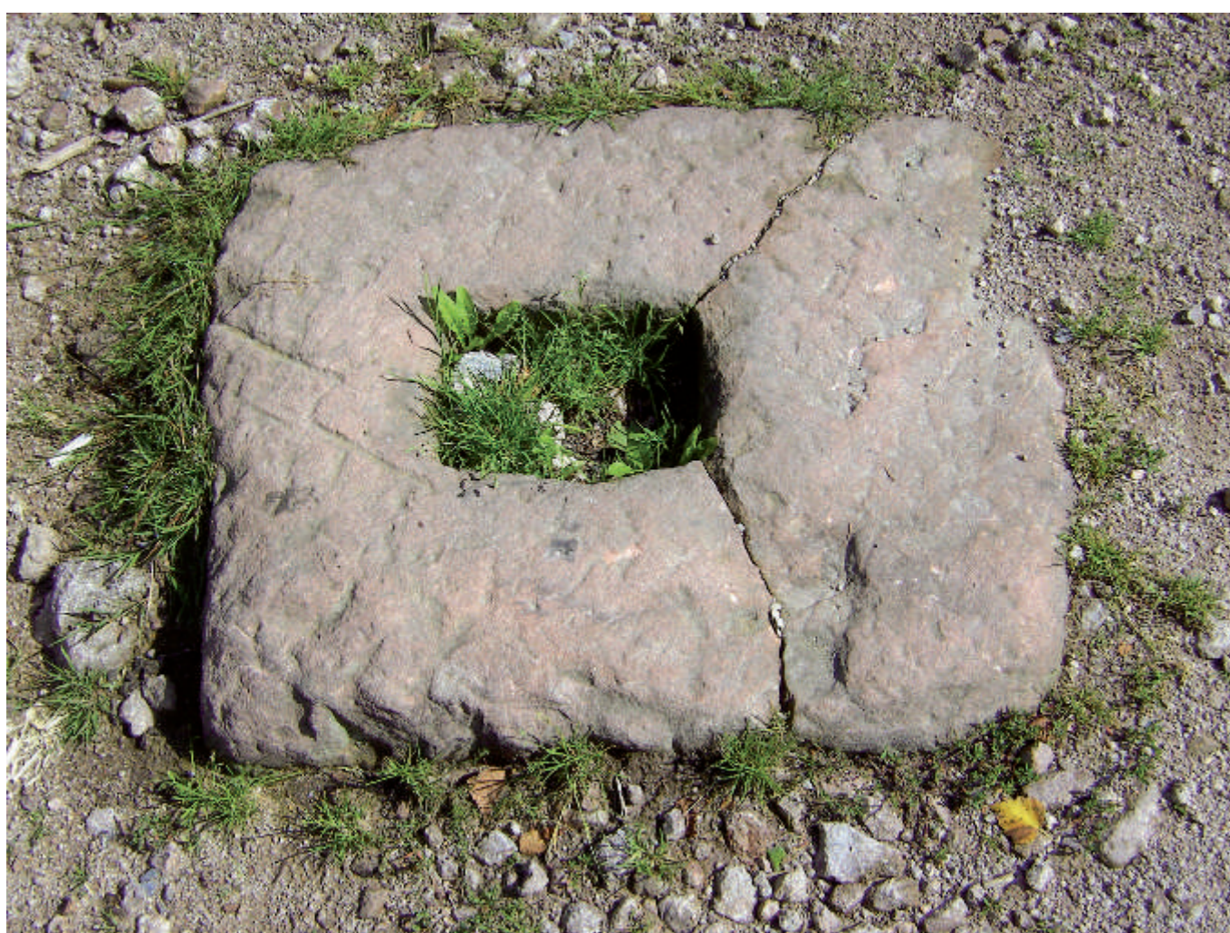
Die Fundamente von Kleindenkmälern nennt man „Tiegelsteine“ - hier ein komplettes Exemplar ohne Säule aus dem Odenwald.

Wegezoll stand den Landesherrn zu, die die Einnahmen (leider nicht immer) zur Instandhaltung der Straßen und Wege verwendeten. Davon bezahlte man auch die Amtsknechte und Landvögte, die die Kaufleute im unübersichtlichen Gelände und bei den damaligen schlechten Straßenverhältnissen begleiteten und vor Überfällen zu schützen hatten.