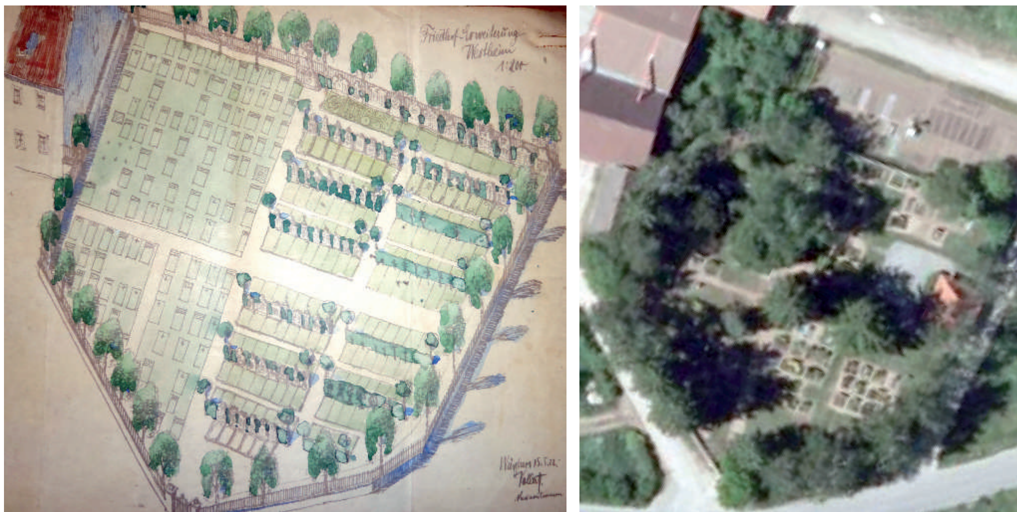
Plan der Friedhof-Erweiterung aus dem Jahr 1922: rechter Hand der neue Abschnitt, in dem sich heute (2014) die Aussegnungshalle befindet, wie im Luftbild zu sehen.

Bis in die 1950er Jahre hinein wurden die Verstorbenen im Trauerhaus aufgebahrt, bevor sie auf dem Friedhof beerdigt wurden. Schließlich wurde 1953 die Aussegnungshalle erbaut, die diese Aufgabe nun übernahm.