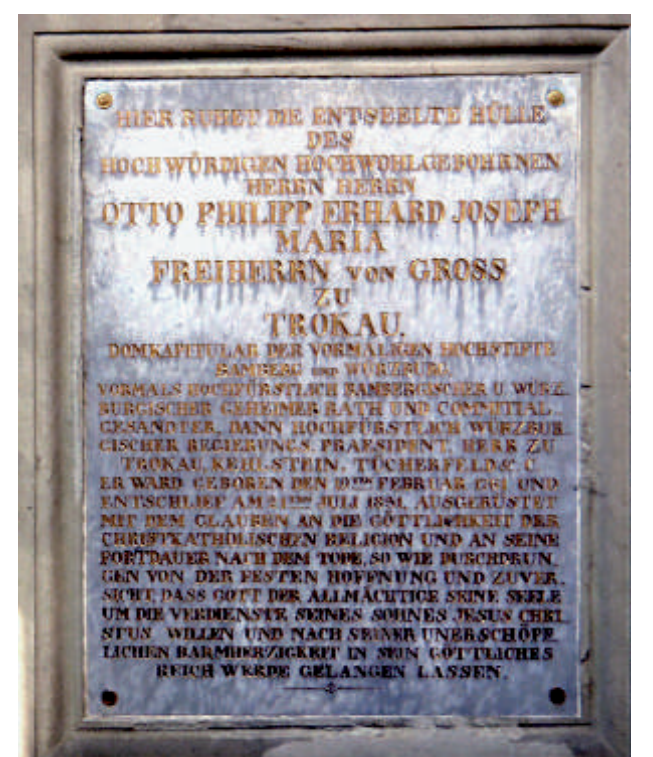
Familienwappen und Grabplatte