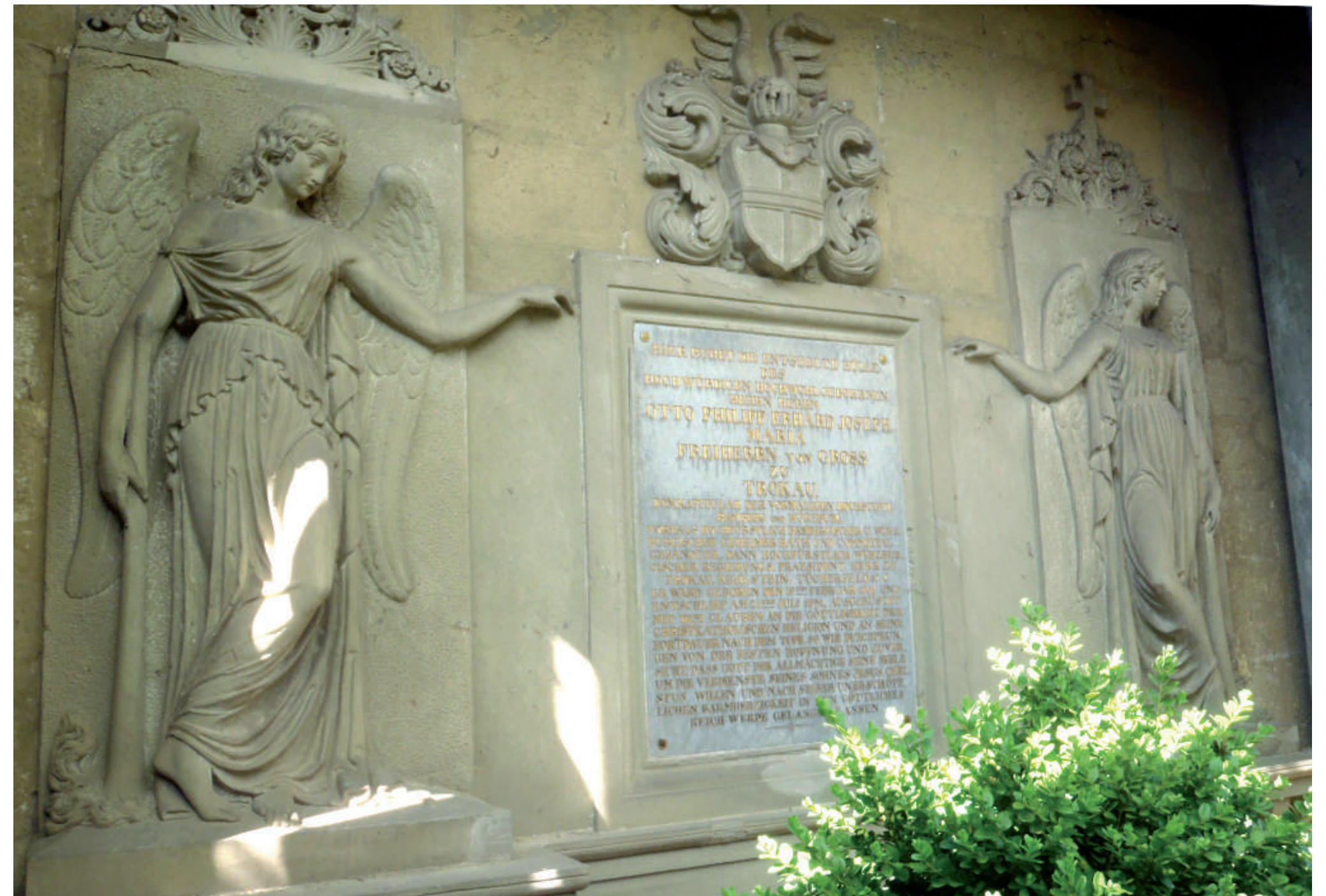
Die Grablege von Otto Philipp Freiherr Groß von Trockau befindet sich im Dorf auf dem Areal des ehemaligen „Schlosschens“ und kann nicht besichtigt werden. Eine Verlegung des außergewöhnlich gestalteten Grabmals mit dem steinernen Sarkophag auf den Friedhof ist angedacht.

Der Würzburger und Bamberger Domherr (1761-1831) kaufte 1772 vom Würzburger Domherrn Philipp von Zobel den Westheimer Domherrenhof.