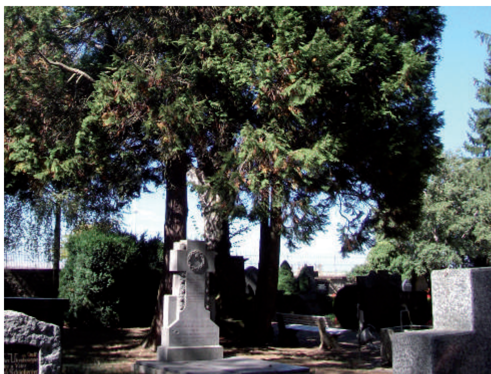
Der parkähnliche Charakter des Friedhofs wird besonders durch den Gegensatz der direkt daneben beginnenden Agrarlandschaft deutlich.

In der Mitte der Friedhofanlage befindet sich ein außergewöhnliches Grabdenkmal aus dem Jahre 1834. Es ist mit aus rotem Sandstein herausgehauenen Getreideähren verziert und mit Weintrauben umkränzt. Dabei handelt es sich um das Grabdenkmal für den „Gastwirth und Oekonom“ Johann Kilian Maier.