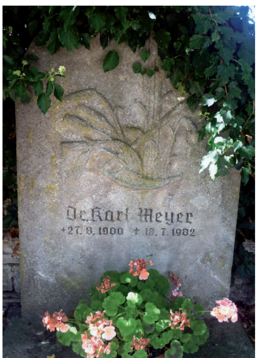
Zwei Grabsteine sind von dem Künstler Richard Rother gestaltet worden, der im Ortsteil Biebelried oftmals im Hotel Leicht zu Gast war und im Ortsteil Kaltensondheim die Kopie des Weihnachtsbildstocks geschaffen hat.

Der aufwendig gestaltete Grabstein ist ein frühes Zeugnis für den Wohlstand, der durch die Landwirtschaft im 19. Jahrhundert erreicht werden konnte und der sich auch durch die großen, damals neuen, Anwesen bemerkbar machte (= Steinernes Herz Mainfrankens).