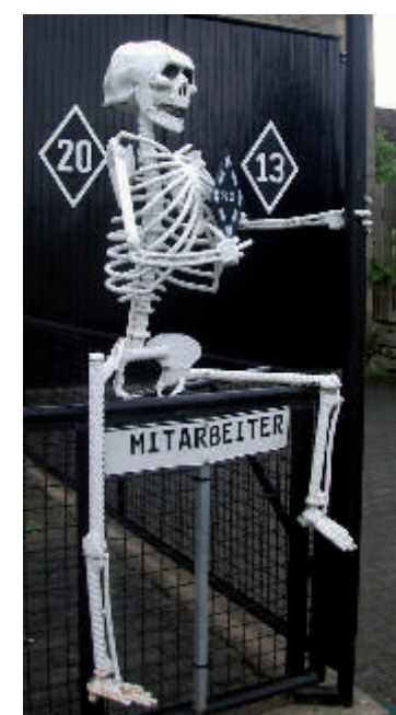
Er kommt nicht vom Friedhof: Bei der Einfahrt nach Westheim von der Biebelrieder Seite passiert man eine seltsame Gestalt - das Maskottchen des Motorradklubs.