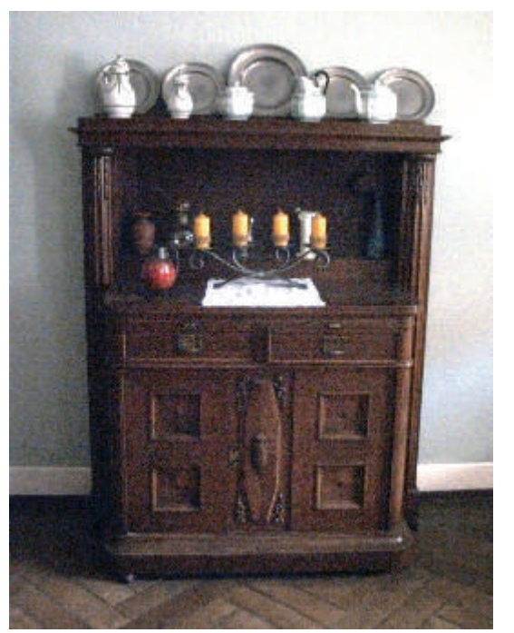
Einrichtung eines „Weihnachtszimmers“ in Kaltensondheim (2014); besonderer Luxus: ein sich drehender Christbaumständer.