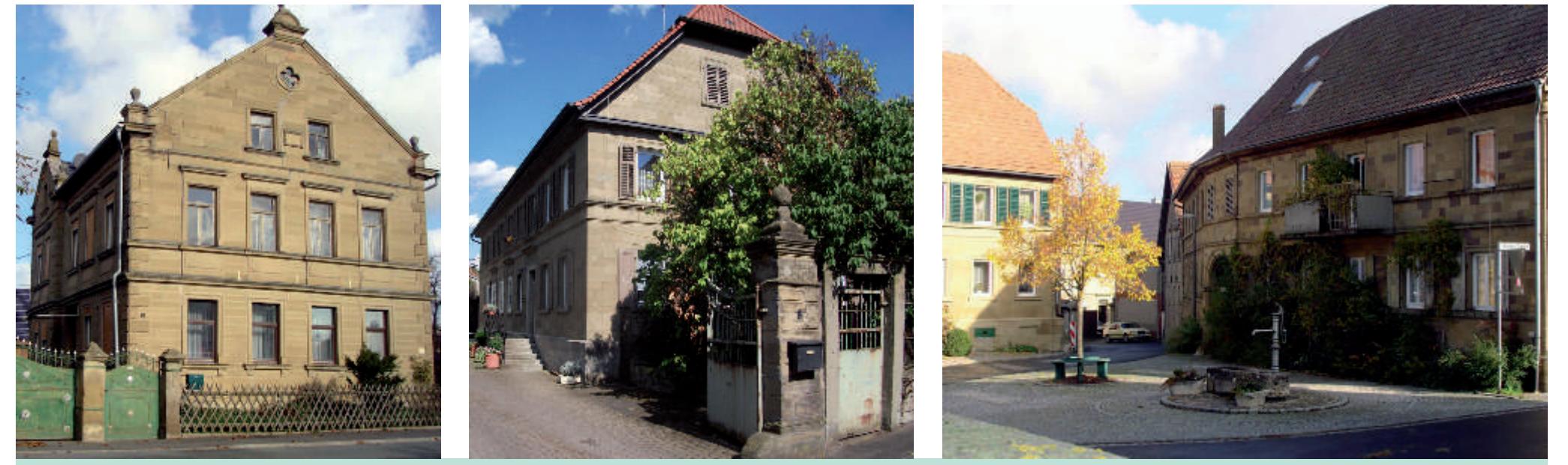
Eine Auswahl der großen Bauernhäuser in Kaltensondheim - sie stehen für das „Steinerne Herz Mainfrankens“.

Große Anwesen aus der zweiten Hälfte des 19. und vom Beginn des 20. Jahrhunderts sind auch für Kaltensondheim kennzeichnend.