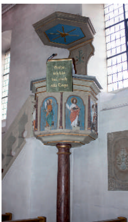
Die steinerne Kanzel und der Taufstein aus dem 16. Jahrhundert stammen wahrscheinlich aus dem Vorgängerbau der Andreaskirche. Über dem Haupteingang ist die Jahreszahl 1579 zu lesen - das Jahr des ersten Kirchenneubaues.

Der älteste Gebäudeteil ist der untere Kirchturm, wo sich im Inneren der Chorraum mit dem Hauptaltar befindet. Das 2. Stockwerk mit den barocken Fenstern und darüber mit der nachempfundenen typisch mainfränkischen Julius Echter Kirchturmspitze wurden 1731 hinzugefügt.