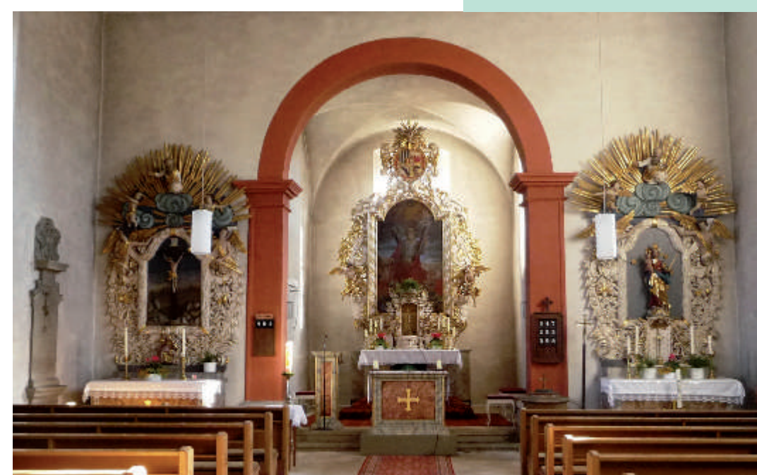
Altarraum mit dem böhmischen Altarensemble