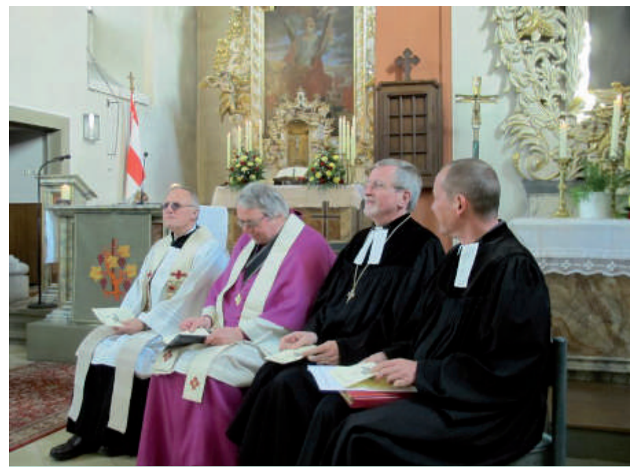
Beide Konfessionen sind in der Andreaskirche beheimatet.

1453 wird von einer Marienkapelle berichtet, um 1550 wurde Kaltensondheim evangelisch. In diesem Zusammenhang markiert die Jahreszahl 1579 über dem Westportal den Neubau, bzw. die Erweiterung der Kirche. Aus dieser Zeit stammt der Taufstein mit Renaissanceverzierung mit der Jahreszahl 1586 und die Kanzel. Seit 1701 teilen sich beide Konfessionen das Gotteshaus und praktizieren die Ökumene als gelebte Wirklichkeit. Da hier gleich viele katholische und protestantische Christen lebten, wurde der Neubau am 20. Dezember 1712 als Simultankirche eingeweiht.