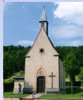
Die Kapelle in Eichenberg

Bitte folgen Sie dem Zeichen des gelben EU-Schiffchens auf blauem Grund.