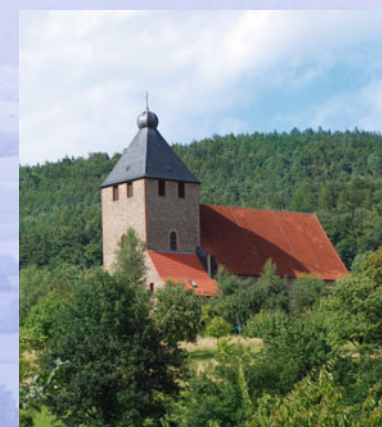
Die neue Wendelinuskirche in Eichenberg