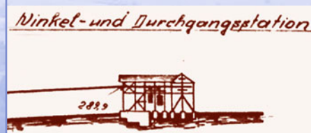
Eine Skizze ist der einzige Hinweis auf das Aussehen der Winkelstation.

In einem Steinbruch an der Eichenberger Kuppe wurde Dolomit abgebaut und dann mit der Seilbahn zum Blankenbacher Kalkwerk befördert. Dort wurde der Dolomit schließlich gebrochen und im Ofen zu Brantkalk gebrannt, der zur Herstellung von Mörtel zum Mauern weiterverarbeitet wurde. Die Seilbahn führte über ein Gefälle von 114 Höhenmetern über die »Winkelstation« zum Kalkwerk Blankenbach. In der »Winkelstation«, von der heute nur noch Überreste des Fundaments zu sehen sind, wurden die beiden Zweigtrassen von Sommerkahl und Eichenberg für den Weitertransport nach Blankenbach zusammengeführt.