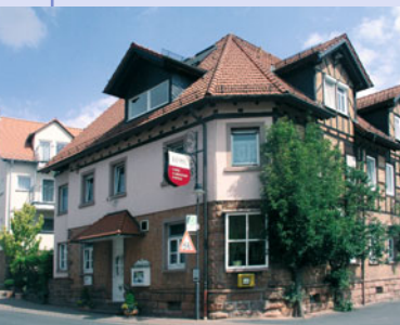
Ein weiterer Startpunkt des Kulturweges befindet sich am Blankenbacher Bahnhof neben dem Hotel Brennhaus Behl (ehemaliger Gasthof »Zur Linde«).

Mit der Eröffnung der Kahlgrundbahn im Jahr 1898 erfuhr der Kahlgrund einen bedeutenden Aufschwung. Zum einen durch eine bessere Verkehrsbindung in das Rhein-Main Gebiet, zum anderen diente die Bahn als Transportmittel für Obst und Kalk aus dem Werk in Großblankenbach. In der Umgebung von Blankenbach findet man heute noch zahlreiche Streuobstwiesen – Ursprung des Kahlgründer Apfelweins, der bis in den Frankfurter Raum bekannt ist.