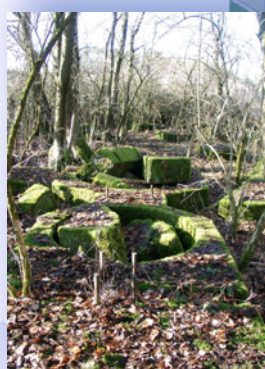
Die Fundamente der Winkelstation