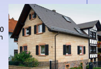
Der weiße Sandstein vermauert in Blankenbach (oben) und Eichenberg (unten)