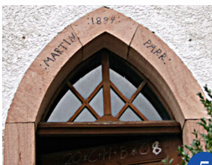
Detail der Erlenbacher Kapelle

Erlenbach erscheint in den Schriftquellen erstmals in der zweiten Hälfte des 13. Jahrhunderts. Damals befand sich auf dieser Gemarkung vermutlich nur ein einziger Hof mit dazugehörigen Feldern. Prägend für den Weiler ist die Kapelle oberhalb des Dorfbrunnens. In der Nähe stand am Fluss Kahl die so genannte »Flederichsmühle«. In den 1980er Jahren wurde das auffällig gewordene Haus abgetragen und im Freilichtmuseum Bad Windsheim neu aufgebaut.