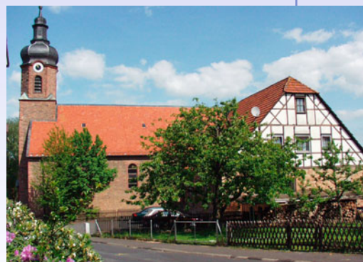
Die Blankenbacher Kirche mit der ehemaligen Schule