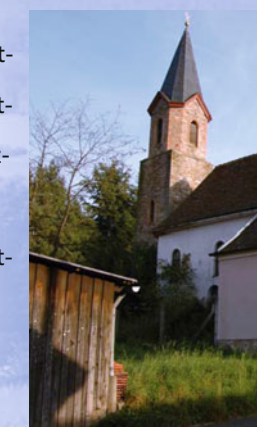
Die alte Wendelinuskirche (2009)

Im Jahr 1740 wurde in Eichenberg die erste Wendelinuskirche erbaut. In den 1930er Jahren entschied man sich für einen Neubau, der nach dem Zweiten Weltkrieg fertig gestellt wurde. Eine Vielzahl von Bau- und Steinmetzarbeiten sowie die Finanzierung mit Hilfe von Spenden übernahmen die Eichenberger. Das Dorfbild von Eichenberg wird wesentlich von einer Häusergruppe am südlichen Ortseingang geprägt. Die vier Hakenhöfe haben ihren historischen Charakter weitgehend bis heute bewahrt.