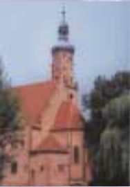
Die 1905 vollendete Stephanuskirche, die im Stil des Historismus erbaut wurde