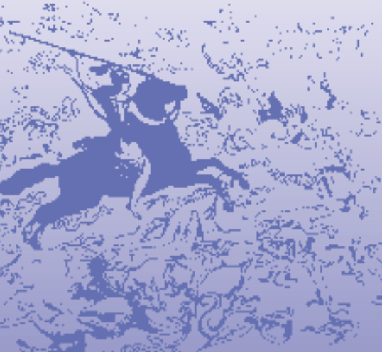
Frau Holle als »Hulda« mit ihrem Gefolge

An mehreren Orten im Spessart erzählt man sich die Sage der Frau Holle, der regional am häufigsten auftretenden Gestalt aus der Mythologie. Allgemein bekannt wurde Frau Holle durch die Märchen der Gebrüder Grimm. Auf dem Högberggrücken liegt einer (von früher dreien) Frau-Holle-Steinen. Wie dieser Findling mit der beckenartigen Vertiefung hierher kam, ist unbekannt. In Oberbessenbach erzählte man den Kindern, dass es schneie, wenn Frau Holle hier ihre Betten ausschüttelte. Doch gibt es für diese Gesteinsform eine natürliche Erklärung.