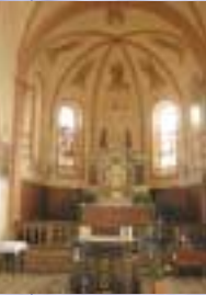
Innenansicht der Stephanuskirche mit dem Chorraum

Der europäische Kulturweg beginnt an der Stephanuskirche, die von Prof. Theodor Fischer, einem der berühmtesten Architekten Deutschlands zu Anfang des 20. Jahrhunderts im Stil des Historismus entworfen wurde. Fünfzehn Jahre lang kämpfte die Oberbessenbacher Gemeinde, bis die nötigen Mittel für den Neubau beschafft waren. Bei der Innenausstattung, die 1905 vollendet wurde, ragen das Deckengemälde und die farbigen Glasmalereien heraus, auf denen die benachbarten Kirchenbauten abgebildet sind.