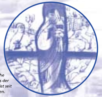
Das spätgotische Glasfenster aus der Ottilienkirche ist seit 1928 verschollen.

Auf den ersten Blick prägen zwei Kirchen das Ortsbild Oberbessenbachs: die große Stephanuskirche und die kleine Ottilienkirche. Zwischen ihnen liegen 500 Jahre Geschichte des Dorfes an der alten Poststraße nach Würzburg.