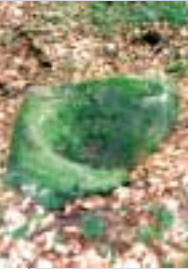
Der Frau-Holle-Stein auf dem Högberg ist ein geologisch interessantes Phänomen.