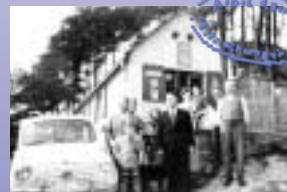
Die »Erfrischungshalle« Keiner, in Betrieb von 1952 bis 1956

Le circuit pédestre d'une longueur d'environ 12 km vous mène d'abord, à la montée, d'Oberbessenbach au »Frau-Holle-Stein« sur la colline de Hagberg. Après avoir traversé l'ancienne route nationale, vous avancez vers la carrière de la firme Keiner. Toujours à la montée, vous arriverez au »Posthalterskreuz« (le Crucifix de la poste aux chevaux). De là-bas, vous descendez vers le village en passant devant le »Gänskreuz«. Suivez toujours le marquage, c'est-à-dire le bateau jaune de l'Union européenne sur fond bleu.