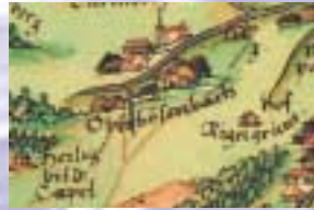
Pfünzing-Karte (1594) mit Oberbessenbach (Oberbösenbach)