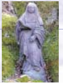
Plastik der heiligen Otilie am Ottilienbrunnen, der früher ein Wallfahrtsort war