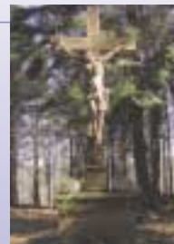
Das Posthalterskreuz an der alten Poststraße

Wann das Posthalterskreuz errichtet wurde, ist nicht bekannt. Um seine Errichtung rankt sich die Legende eines Zwischenfalls mit einer Postkutsche. Tatsächlich ist der Weg entlang des Höhenrückens östlich von Bessenbach die hochmittelalterliche Verbindung zwischen Frankfurt und Würzburg. Oberbessenbach dürfte, am Rande dieser Straße gelegen, für das Stift St. Peter und Alexander eine wichtige Rolle beim Einfluss auf die Verbindung nach Osten gespielt haben. Im späten 18. Jahrhundert stiegen die Bedürfnisse des Verkehrs so stark an, dass eine Chaussee gebaut wurde, die auf der heutigen Staatsstraße entlang führt.