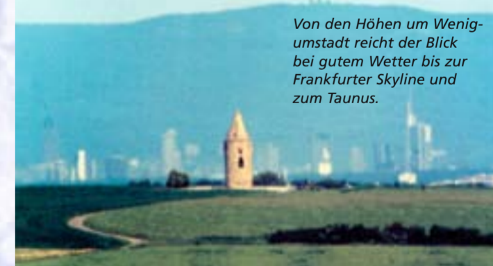
Von den Höhen um Wenigumstadt reicht der Blick bei gutem Wetter bis zur Frankfurter Skyline und zum Taunus.

The first part of the Geopark-Cultural Pathway (6 km long) will lead you through the agricultural landscape to the church and town hall. Having crossed the village centre, the path will lead you uphill through the Gottfriedswald to a lookout. The final station is the 14 Nothelferchapel. Please follow the yellow-on-blue EU boatlet marker.