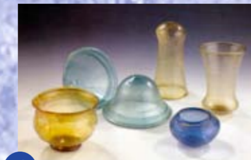
Bei Grabungen im Ortsbereich von Wenigumstadt trat frühmittelalterliches Glas zutage.